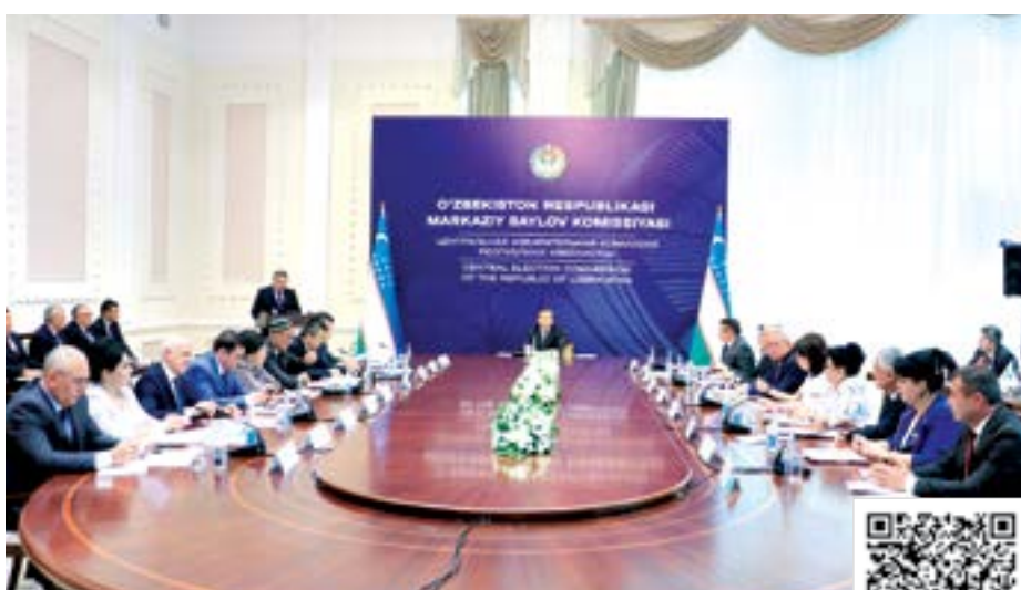
УШБУ МАТЕРИАЛНИ ЛОТИН ЁЗУВИГА АСОСЛАНГАН ЎЗБЕК АЛИФОСИДА УҚИШ УЧУН МАЗКУР QR-KODНИ СКАНЕР ҚИЛИНГ.

Марказий сайлов комиссиясининг ишчи гуруҳи эксперт гуруҳлари томонидан тақдим этилган хулосаларни инобатга олган ҳолда ҳамда сиёсий партиялар тақдим этган ҳужжатлар қонунчилик талабига тўлиқ мос келиши, белгиланган тартибда ва муддатда муурожаат қилинганидан келиб чиқиб, сиёсий партиялар томонидан кўрсатилаётган Ўзбекистон Республикаси Президентлигига номзодларни рўйхатга олиш юзасидан ўз хулосасини тақдим этган. Унга мувофиқ, мажлисда Ўзбекистон Халқ демократик