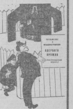
Каков проект: вполне определенно Над Бомном шифтв Вашингтон берет. Он создает для ревахиство Бонна В опасный арсенал запасный ход. Тревожный клч идет по свету: — Скорей закрыть лазейку эту! Рис. Бор. Ефимова, стихи А. Жарова. (Издательство «Антипламат».)

БРЮССЕЛЬ, 12 февраля. (ТАСС). Здесь опубликовано сообщение о том, что в связи с правительственным кризисом визит министра иностранных дел Спаака в Москву в настоящее время состоится не может.