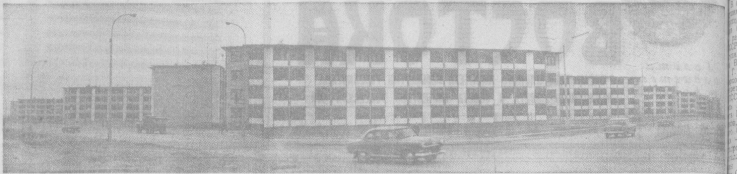
В этом юном городе все современное — дома, освещение, дороги.