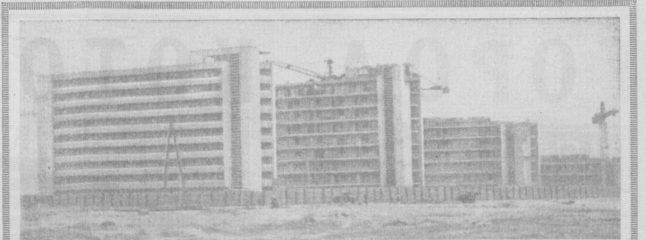
Перед вами, читатель, одно из чудес наших дней. Там, где раньше царствовала пустыня, сейчас властно шагает энергетический человек. Его руками воздвигнут город хижин и эскотриков — Новою. Эта фотография запечатлела примечательный момент — сооружение многоквартирных девятиэтажных домов со всеми удобствами. Таких новостроек в городе много. Наш рассказ о настоящем и будущем города, о том, какие произошли в нем перемены за время с XXII по XXIII съезд партии, читайте на второй странице сегодняшнего номера «Правды Востока».