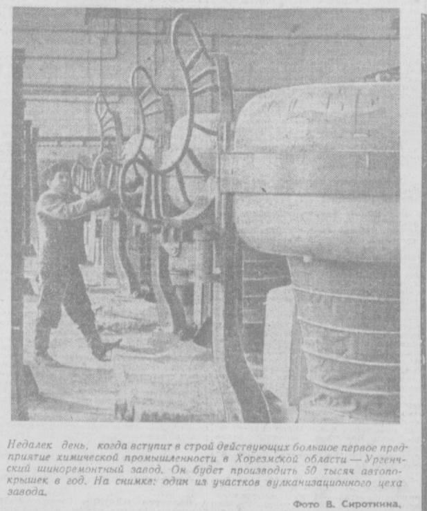
Недалек день, когда вступит в строй действующих большое первое предприятие химической промышленности в Хорезмской области — Ургенчский шиноремонтный завод. Он будет производить 50 тысяч автопокрышек в год. На снимке: один из участков вулканизационного цеха завода.

Где камни — балластные шары — в ущелье-дузу все метут, шесри. Я на вершину поднялся, и вот Ко мне гора с уробой, пристаёт: — Кто ты такой? Ведь камышка не больше, Ты шел ко мне, а я кричала: Боис! Не же страшился всех молл чудес. Скажи, зачем на горы ты залез? ...А я молчал, дышанье затаял. Как хороша была внизу земля... Перепел с узбекского Исхлас ВАКС.