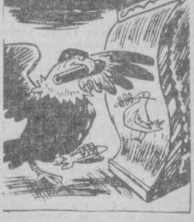
Рисунок из американской профсоюзной газеты «Диспатчер». — Слет мой, зеркальце! Скажи, да всю правду доложи...

Бомбежки и обстрелы территории ДРВ. Национализация частной собственности на Занзибаре. Поддержка агрессии США.