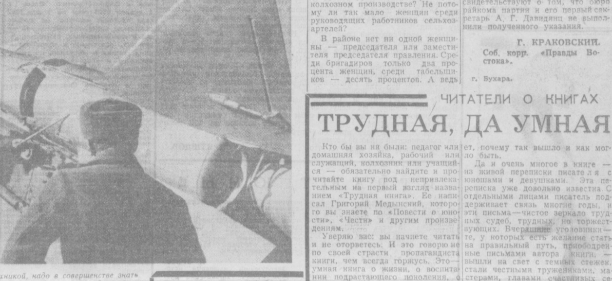
Чтобы отлично владеть военной техникой, надо в совершенстве знать ее. Воины Советских Вооруженных Сил настойчиво и добросовестно повышают свои знания боевой техники. На снимке: воины изучают устройство ракеты.

В декоративный цемент... в тысячи километров за его в Узбекистан из Подгории и Грузии. Потребность республики в этом ценном строительном материале велика. Каждый год требуется до 20 тысяч тонн. Институт химии Академии Узбекской ССР разрабатывает проект перевода на производство редкого материала, идущего на облицовочный цемент. В настоящее время предприятия, производящие цемент, расходуют на 40 тысяч тонн цемента в год, позволяет полностью удовлетворить запросы строительной индустрии Средней Азии и Казахстана. Это будет третьим предприятием в стране по производству облицовочного цемента. Э. АНДРЕЕВ.