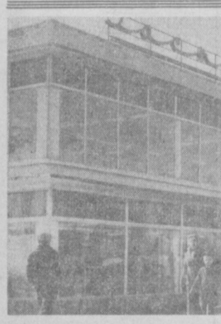
Поселок завода «Ташагаташи» — современный социалистический городок. Рабочие живут здесь в многоэтажных домах, в квартирах со всеми коммунальными удобствами. Для них строятся культурно-бытовые учреждения. Недавно здесь, на улице М. Горького, открылся новый общежитийный «Гастроном». Он оборудован холодильными камерами, складскими помещениями, лифтами для подачи товаров. На снимке: здание нового «Гастронома».