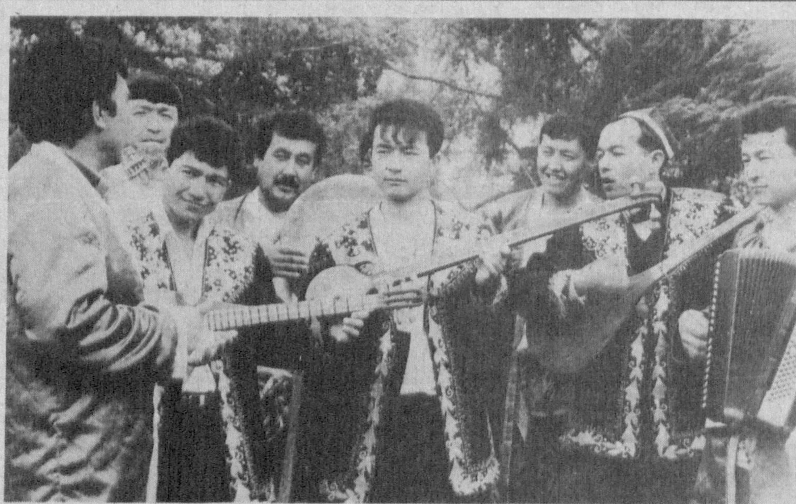
Галлаорол тумани «Гаштак» халқ фольклор этнографик дастаси янги кўшиқ устиде ишламоқда.