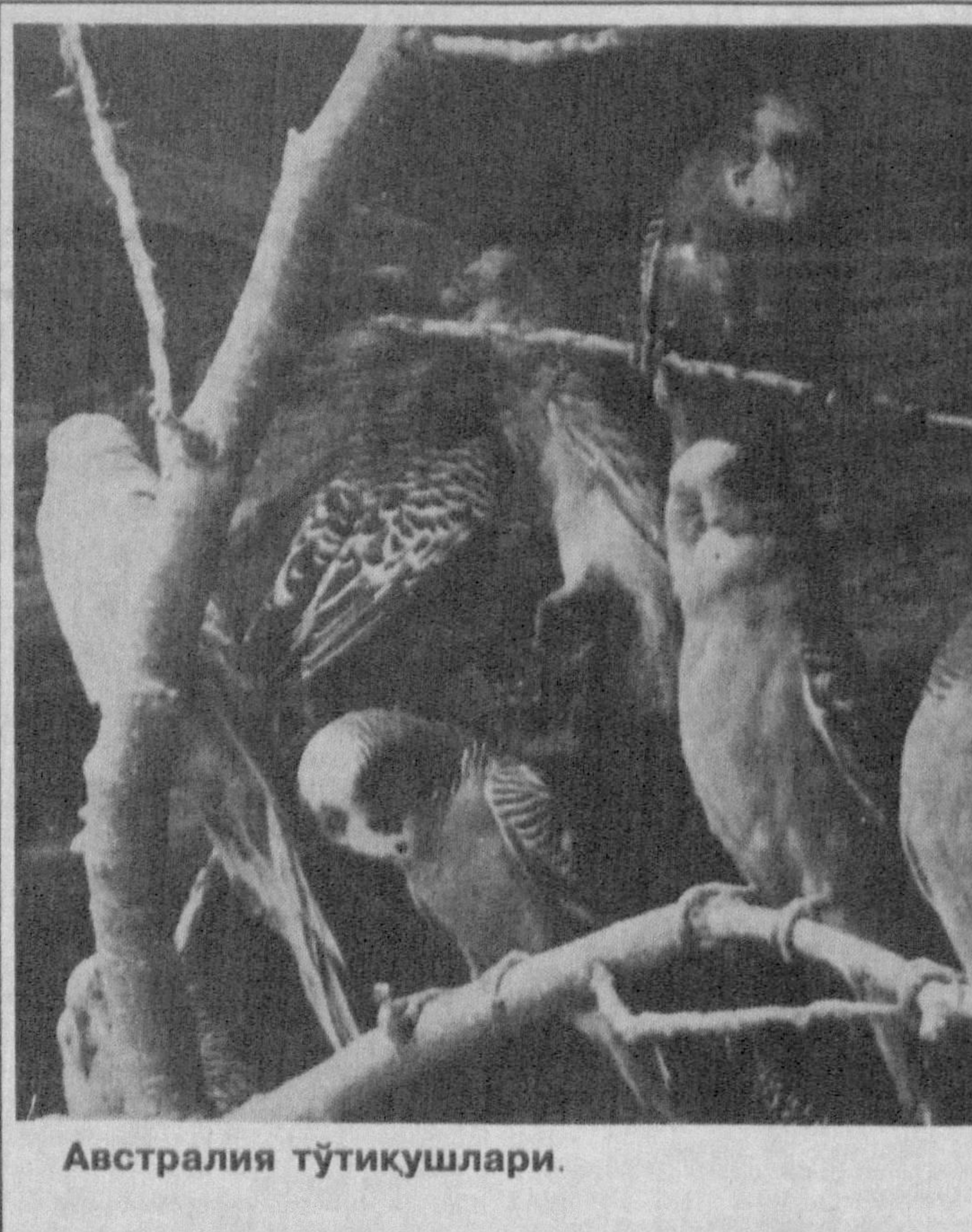
Австралия тўтиқушлари. Л.НАРЗУЛЛАЕВ сурат лавҳаси.