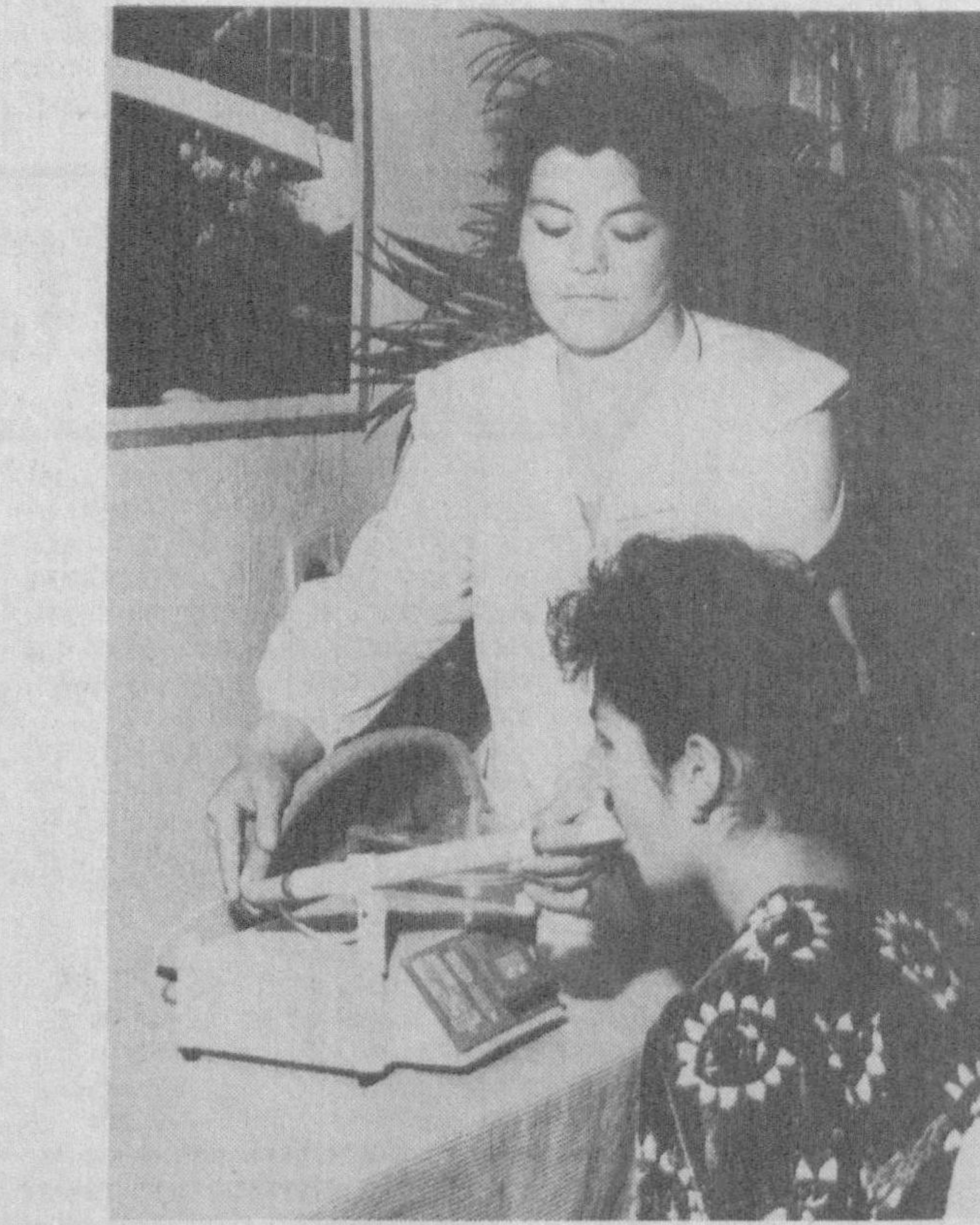
Суратда: «Нихол» санаторийси ҳаётидан лавҳа.

Ер остидан ортиб чиқадиган мана бу сувнинг шифобахшлиги нималарга кўради? Ушбу маъданли сувни