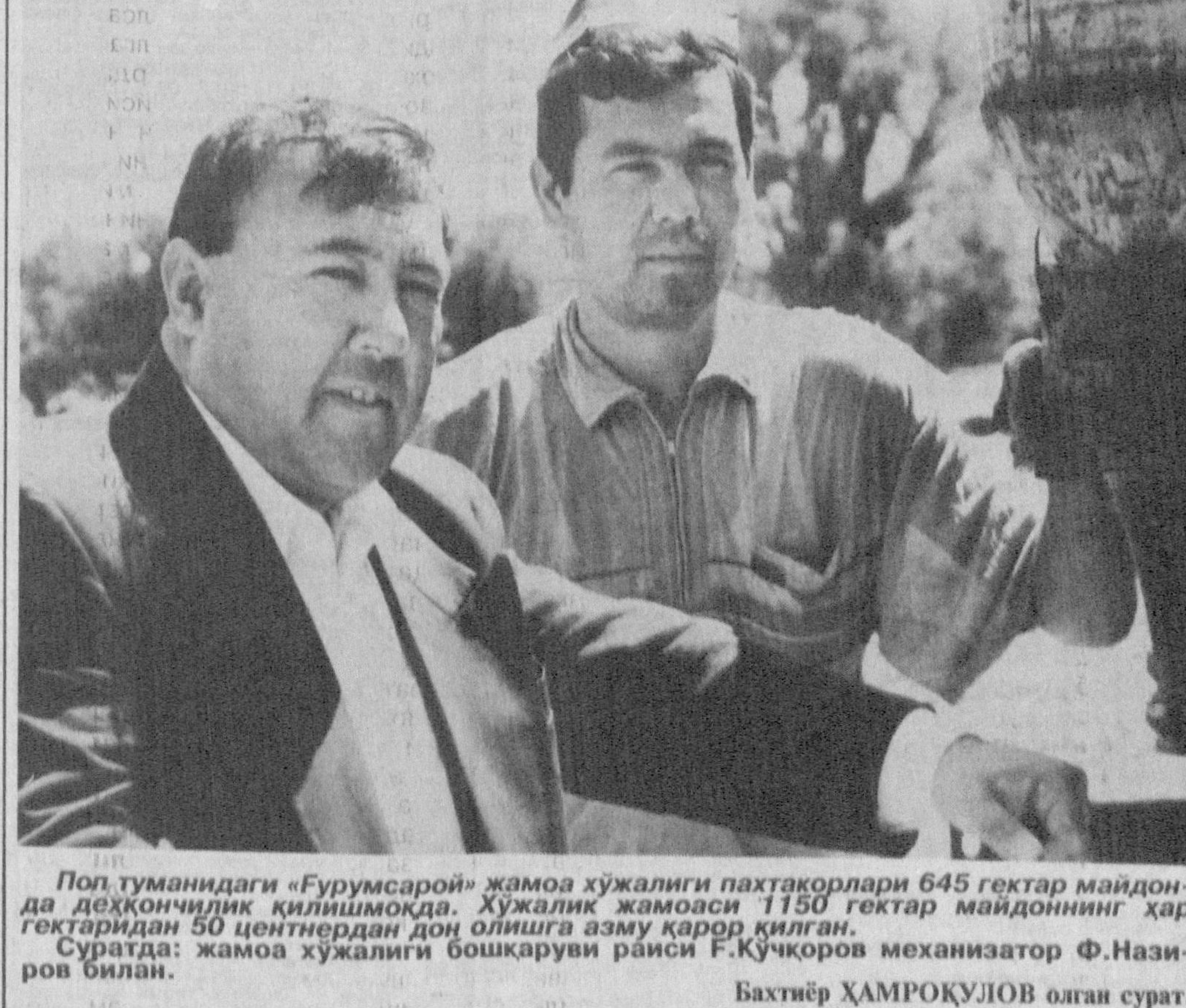
Поп туманидаги «Ғурумсарой» жамоа хўжалиги пахтакорлари 645 гектар майдонда дехқончилик қилишмоқда. Хўжалик жамоаси 61150 гектар майдоннинг ҳар гектаридан 50 центнердан ортиқроқ ҳосил олишга азму қарор қилган.

Режалар бисeр. Уни амалга оширишимиз, ўзи бўлади. Бунинг учун биз жамон тажрибасини ўрганишимиз шарт. Мамлакатимиз мустиқилликка эришган ишбилармон, тadbиркор кишиларга имкониятлар тўғри келтириб бериш шарт. Биз ундан самарали фойдаланишимиз, эл-юртга кўпроқ фойда келтиришимиз шарт.