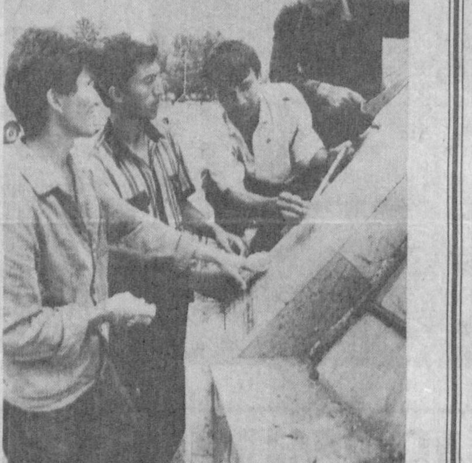
Х.ШУКУРОВ, ЎЗА мухбири. Суратда: бир гуруҳ уруглиқ усталар.

Хозир Хартангдаги Имом Исмоил ал-Бухорий масжид мужмуасини қайтадан қуриш, таъмирлаш ишлари қизгин давом эттирилмоқда. Бу ишларнинг бир қисми ҳашар йўли билан бажариляпти. Масжидга элтувчи Оқдарё кўпригиндан ўтган жойдаги Ястена атрофини ободонлаштиришда уруглиқ усталар фидойилик кўрсатмоқда. Шунингдек, улар бу ерда 150 метрлик мрамар девор тиклаш ишларида ҳам фаол иштирок этяпти. Бу қурилиш ва тиклаш ишлари кўпчилиқнинг хайр-эхсон пули ҳисобига тикланаётгани эса қишларнинг ўтмиш меъросига, азаллий қадриятларга нисбатан меҳр-муҳаббат, авлодларга эҳтиромни тимсоли сифатида намоян бўлаётган.