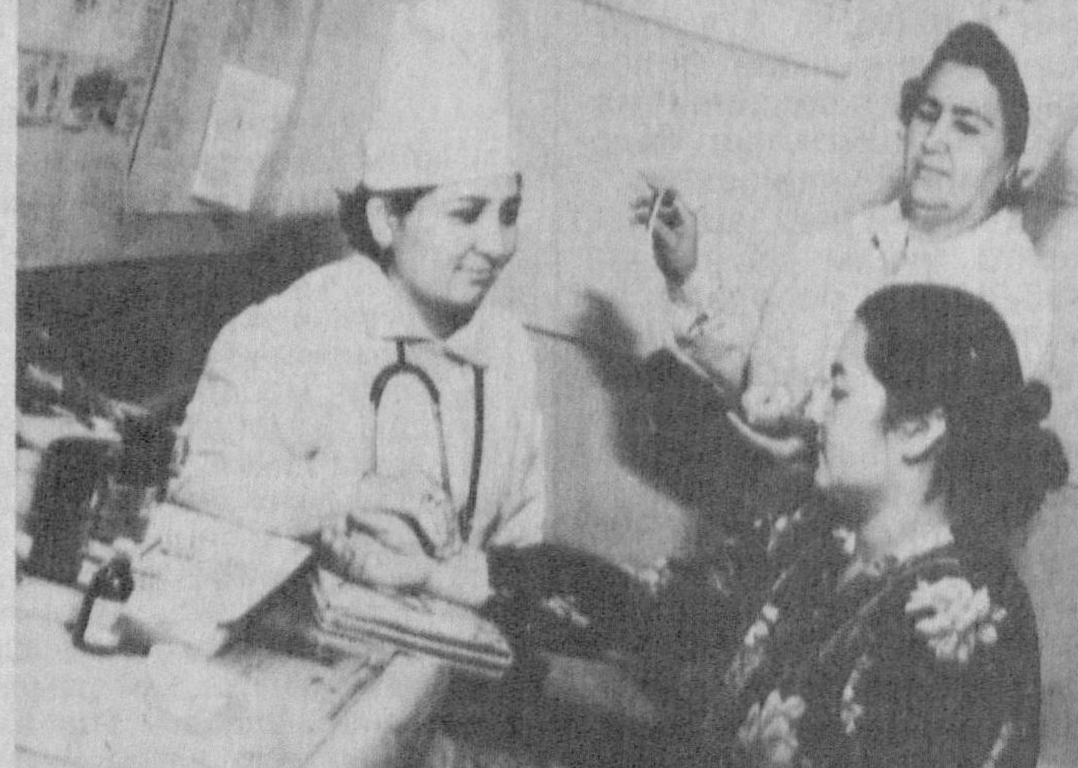
Ўзбекистон касабга уюшмалари мукофоти лауреатлари ҳақида ҳикоялар