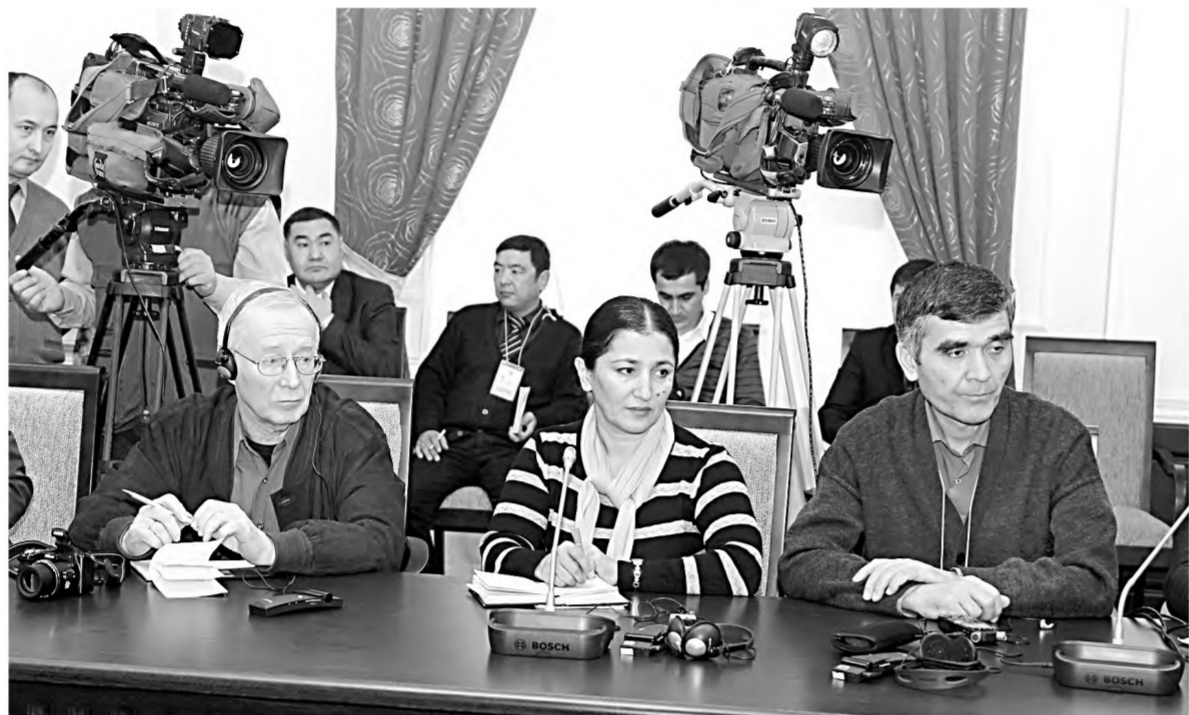
Сайлов ШОУЎЛАЙ АНОВ олган суратлар.

амал қилинган. Хусусан, сайлов тўғрисидаги қонунчиликка мувофиқ, сиёсий партияларга ва депутатликка номзодларга сайловолди ташвиқоти амалга оширишда, сайловчилар билан учрашувлар ўтказишда, сайловолди дастурлари мазмун-моҳиятини сайловчиларга етказиш учун оммавий ахборот воситаларида чиқиш қилишга тенг ҳуқуқ ва имкониятлар яратилган.