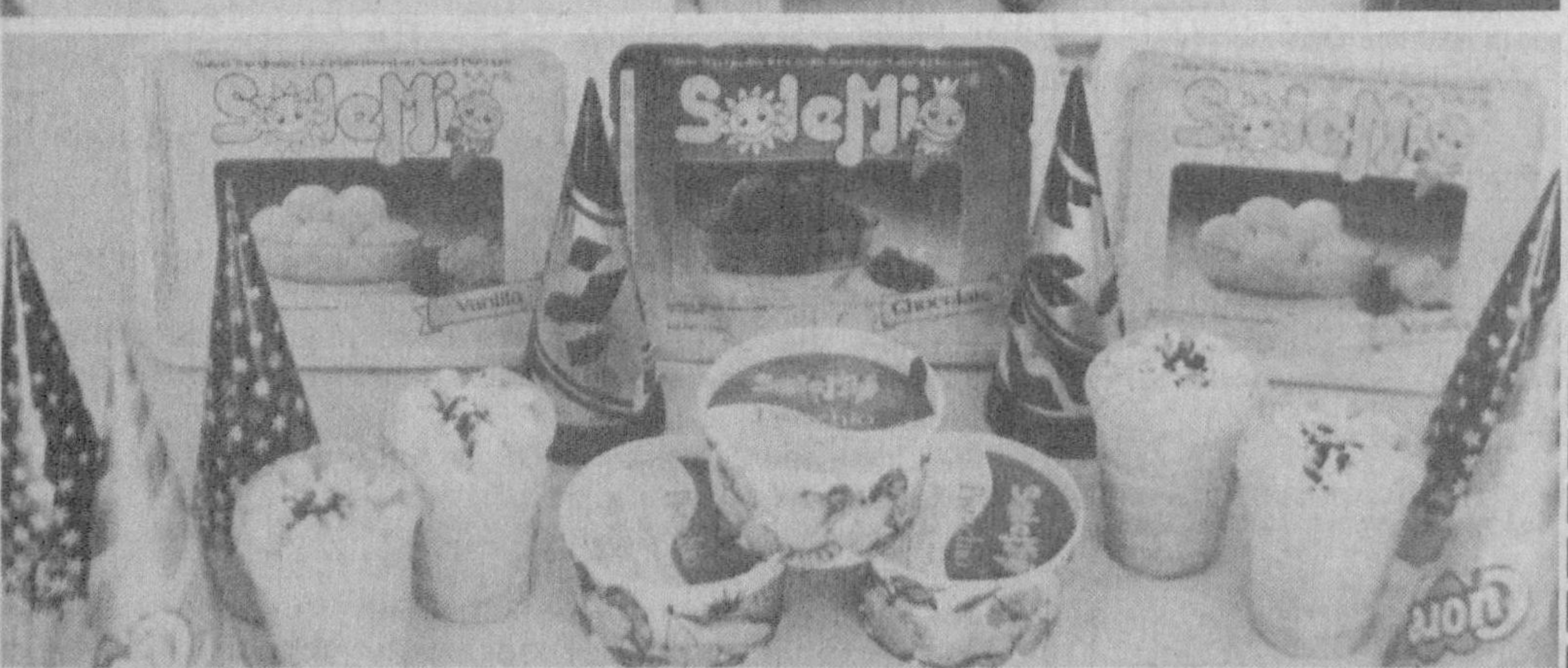
Сирдарё вилояти, Сайхунжёлда Ўзбекистон - Швейцария қўшма корхонаси иш бошлаганига кўп бўлгани йўқ. Шунга қарамай, унинг таъбибдорлиги 14 турдаги сўт ва сўт маҳсулотларига талаб кўп сайин ортиб бормоқда. Жамоа ахли айни кунларда ўз маҳсулотларини Тошкент, Сирдарё, Гулистон шаҳарлари ва Тошкент вилоятининг Ҳазратбек, Оққўрғон, Бекбоёқ туманлари аҳолисига етказиб бормоқда.

Суратларда: илм-фан уюшмалари ўзбекистонлик аҳолига етказиб бормоқда. Тейёр маҳсулотлар.