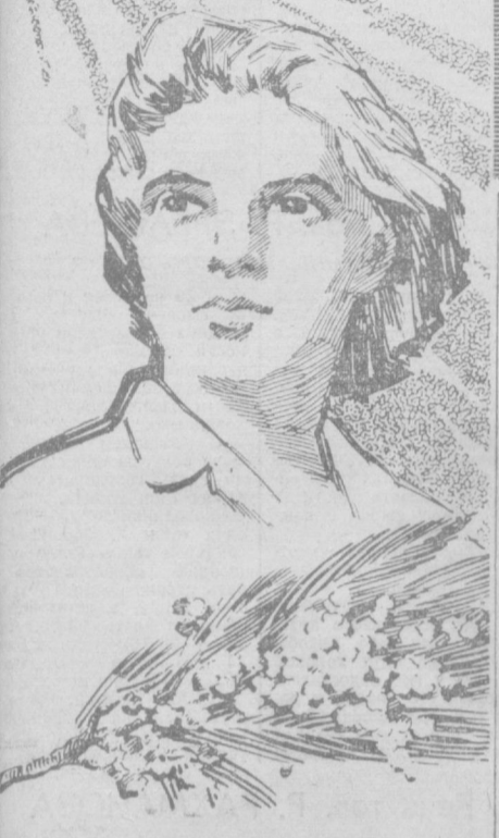
Плакаты художника Р. Иванова. (Фотохроника ТАСС).

НЬЮ-ЙОРК, 7 марта. (ТАСС). Вблизи одной из деревень в 7 миль северо-западно от Квангвай всю ночь на 6 марта шла ожесточенная бой между отрядами армии Освобождения Южного Вьетнама и подразделениями морской пехоты США. Как сообщает корреспондент агентства АП, в этом бою участвовало около 4 тысяч солдат морской пехоты. Американцы понесли самые крупные потери за весь период войны в Южном Вьетнаме.