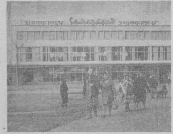
На Ташкентской улице в старой части Самарканда открылся новый трехэтажный университет. Благодаря большому выбору товаров и отменному обслуживанию он завоевал большую популярность у жителей города. На снимке: общий вид университета.