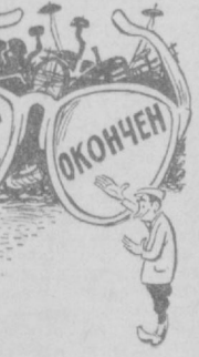
Очковитатель за работой. Рис. М. Воробейчикова.

П. СЕЛЕЗНЕВ, Внештатный корреспондент «Правды Востока».