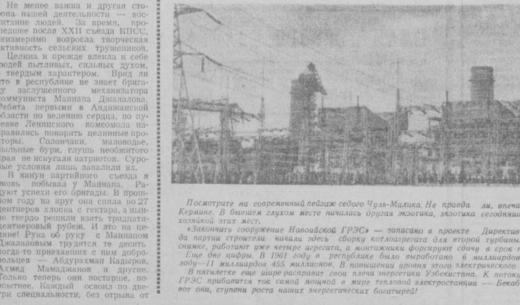
Посмотрите на современный пейзаж сегоду Чул'-Малика. Не правда ли, впечатляющая картина? Ушла в прошлое чабанья экзотика степей сегодняшнего дня — большой хамма и энергетика. И быть ей отныне хозяйкой этих мест.

В первые дни предвзвездной выхты покорители Ферганской целины выполнили семилетний план производства сельскохозяйственной продукции. Сегодня, в день открытия XXIII съезда партии, они рапортуют о полной готовности к севу хлопчатника.