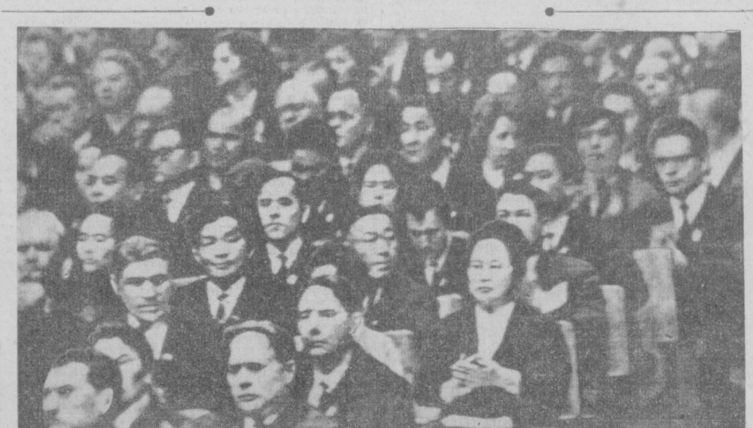
В зале заседаний XXIII съезда КПСС.

Типография объединенного издательства ЦК Компартии Узбекистана, г. Ташкент. P.08255. Изд. № Г-379. Индекс 64572.