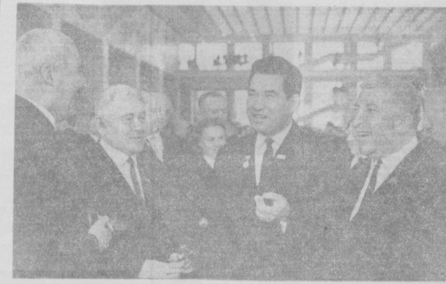
МОСКВА. XXIII съезд Коммунистической партии Советского Союза. На снимке: делегаты съезда (слева направо) — писатель К. Симонья (Москва), М. Амиров (Татарская АССР), Ч. Айматов (Киргизская ССР) и Р. Гамзатов (Дагестанская АССР).

Партийная организация респу... ...блики делает все необходимое для... ...устранения ранее допущенных в... ...сельском хозяйстве недостатков и... ...ошибок. Под посевы текущего го... ...да было вспахано безотвальным