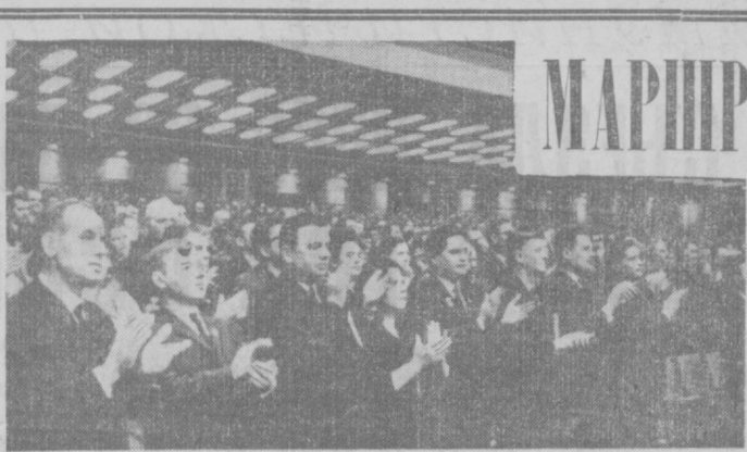
На утреннем заседании XXIII съезда КПСС 4 апреля, как известно, было сообщено о том, что автоматическая станция «Луна-10» стала первым в мире искусственным спутником Луны. На снимке: делегаты съезда applaudуют этому сообщению.

№ 78 (15023) | Среда, 6 апреля 1966 года | Цена 3 коп.