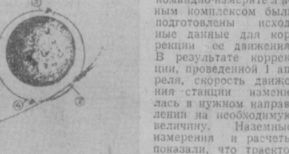
Выход искусственного спутника Луны на орбиту. 1. Промежуточная траектория. 2. Точка выключения тормозной двигательной установки. 3. Периселений орбиты. 4. Апоелений орбиты.