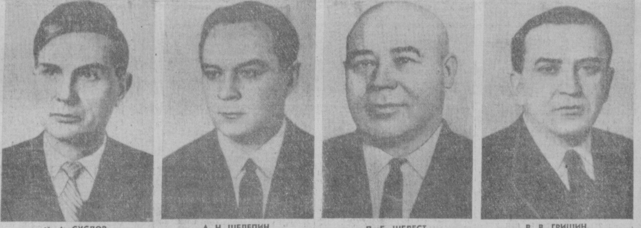
М. А. СУСЛОВ. Член Политбюро ЦК КПСС, секретарь ЦК КПСС. А. Н. ШЕЛЕПИН. Член Политбюро ЦК КПСС, секретарь ЦК КПСС. П. Е. ШЕЛЕСТ. Член Политбюро ЦК КПСС. В. В. ГРИШИН. Кандидат в члены Политбюро ЦК КПСС.