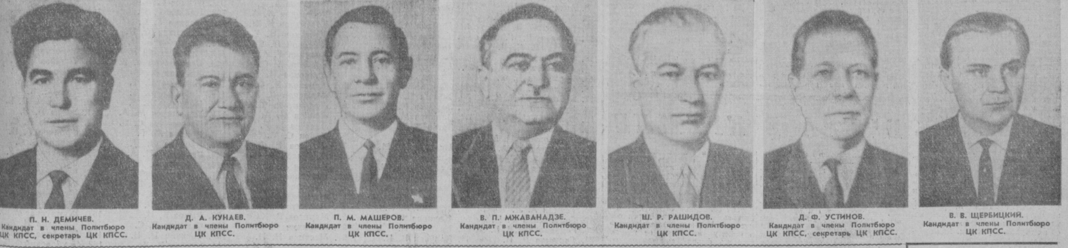
П. Н. ДЕМИЧЕВ. Кандидат в члены Политбюро ЦК КПСС, секретарь ЦК КПСС. Д. А. КУНАЕВ. Кандидат в члены Политбюро ЦК КПСС. П. М. МАШЕРОВ. Кандидат в члены Политбюро ЦК КПСС. В. П. МЖАВАНДЗЕ. Кандидат в члены Политбюро ЦК КПСС. Ш. Р. РАШИДОВ. Кандидат в члены Политбюро ЦК КПСС. Д. Ф. УСТИНОВ. Кандидат в члены Политбюро ЦК КПСС, секретарь ЦК КПСС. В. В. ЩЕРБИЦКИЙ. Кандидат в члены Политбюро ЦК КПСС.