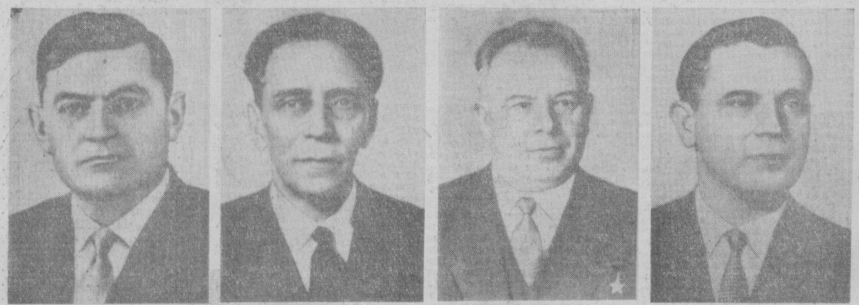
К. Т. МАЗУРОВ. Член Политбюро ЦК КПСС. А. Я. ПЕЛЬШЕ. Член Политбюро ЦК КПСС. Н. В. ПОДГОРНЫЙ. Член Политбюро ЦК КПСС. Д. С. ПОЛЯНСКИЙ. Член Политбюро ЦК КПСС.