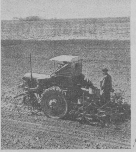
В хозяйствах южных районов Узбекистана полным ходом идет сев хлопчатника. Первыми в Каршинском районе завершают эту работу хлопководы колхоза «Ленинизм». В вынесенном собу земельным этой артели обязались на площади 1.900 гектаров вырастить тридцатцентнеровый урожай. На снимке: один из посевных агрегатов за работой на полях колхоза «Ленинизм».