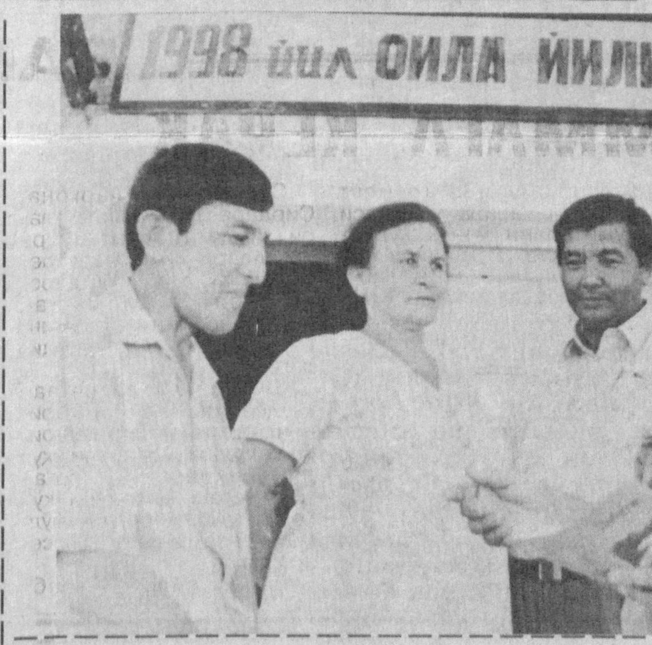
«Истеъдодли болалар ва иқтидорли ёшлар миллиатнинг ўстириб борилувчи ва аниқ мақсадлар йўлида самарали фойдаланиш лозим бўлган «олтин заҳира»сидир.

Uzbek oilasining eng mu-xim bo'lgan uning azolalarini uzaro axil-tuv bulishida namo'ni buladi. Iokurida aytganimizdek, oilada