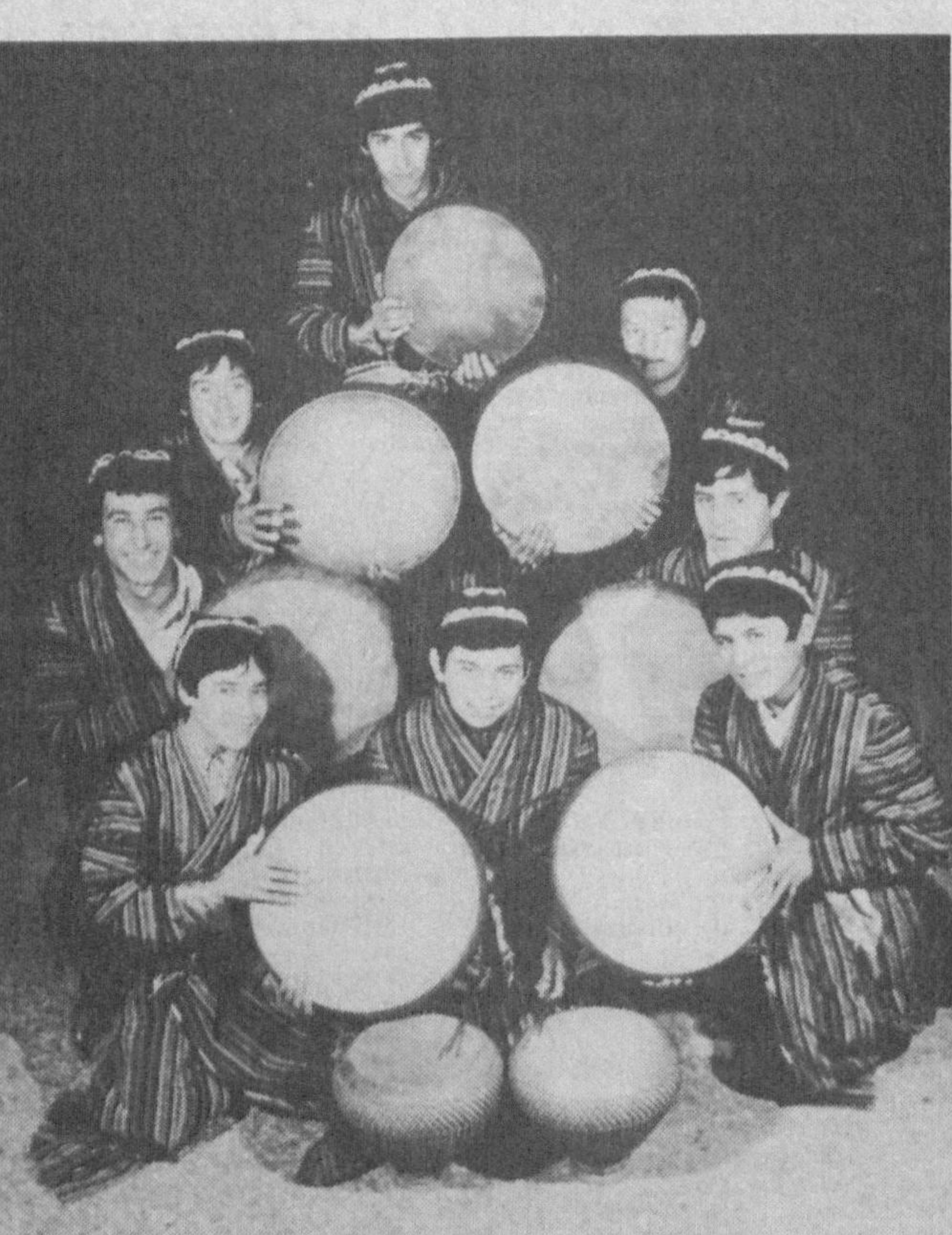
«Қизил тоғ» очик турдаги хиссдорлик жамиятига қарашли Индира Ганди номи маданият саройи доимо санъат илосмандлари билан гапжум.