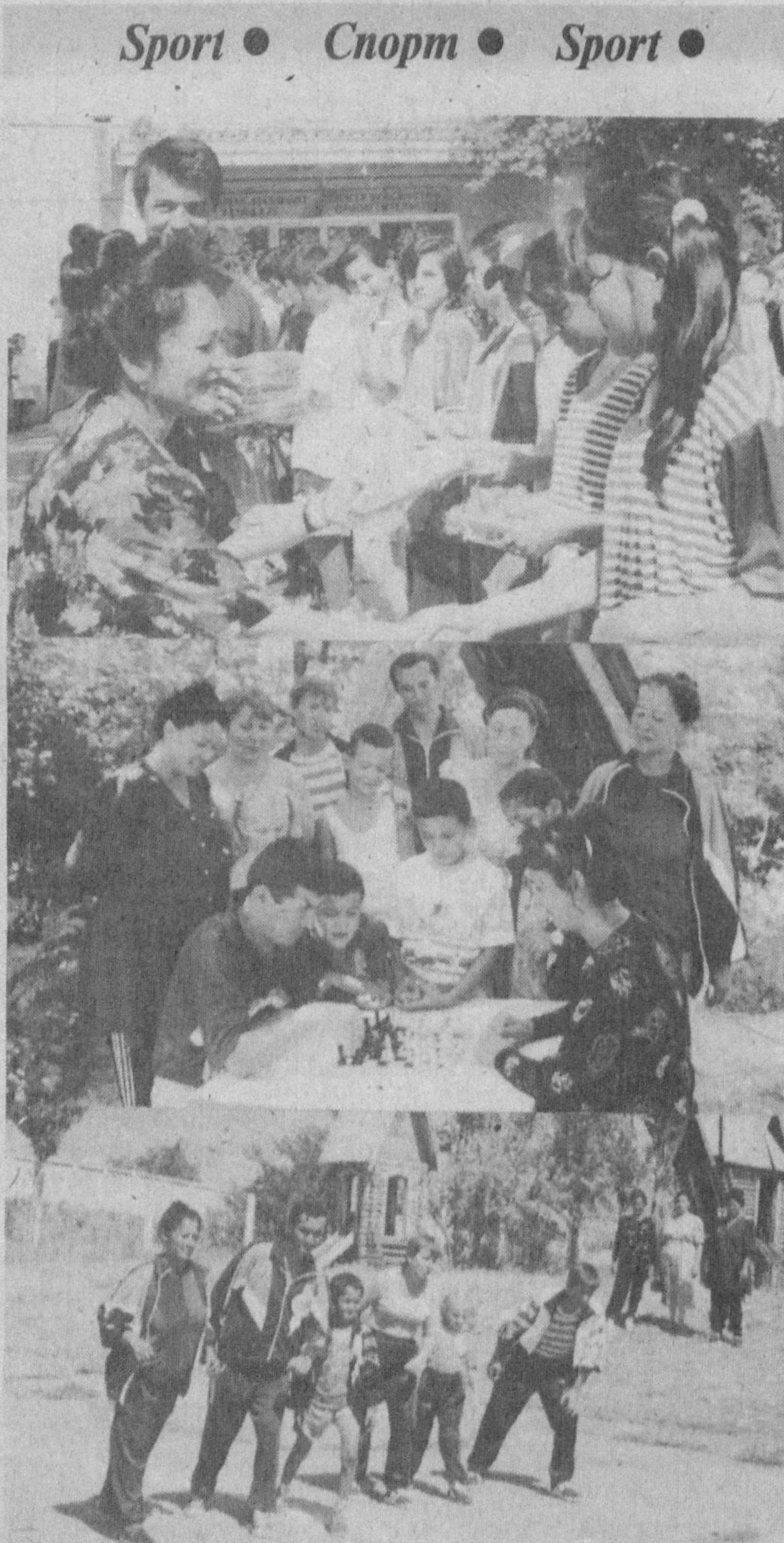
Илгари хабар қилганимиздек, Тошкент вилоятининг «Семург» болалар оромгоҳида Ўзбекистон Давлат муассасалари ва жамоат уюшмаси Марказий қўмитаси томонидан Оила йилига бағишлан-ган спартакиада бўлиб ўтди. Суратларда: спартакиадан лавҳалар.

томлари, ўқувчилар кий-им-бошлари, кўрпа-ёстик ва бошқа махсулотлар кўпчилигининг диққат-эътиборини ўзига қарат-ди. Бу махсулотларнинг ҳаммаси «Бухоротекс» хиссадорлик жамиятида ишлаб чиқариладиган газламалардан тикилган-лиги билан диққатга са-завордир. Икки кун давом этган кўргазма - ёйма савдода «Бухоротекс» хиссадор-лик жамияти 1999 йил-учун республикамизнинг турли қорхона ва ташки-лотлари билан жами 105,5 миллион сўмлик 104 та шартнома тузди. Бу албатта улкан тўқиди-нинг иқтисодий сало-ҳиятини янада мустаҳ-камлашда муҳим ўрин ту-тади. Шубҳа йўқки, «Бухоро-текс» хиссадорлик жамия-тида жаҳон андозала-рига мос келадиган хил-ма хил сифатли махсу-лотлар ишлаб чиқариш, миҳозлар талаб-эҳтиё-жини қондиришда маз-кур хиссадорлик жамия-ти ва республика «Енгил саноат» уюшмаси томо-нидан ташкил этилган кўргазма ёйма савдо кат-та аҳамиятга эгадир. А.ИСТАМОВ, «Ишонч» мухбири.