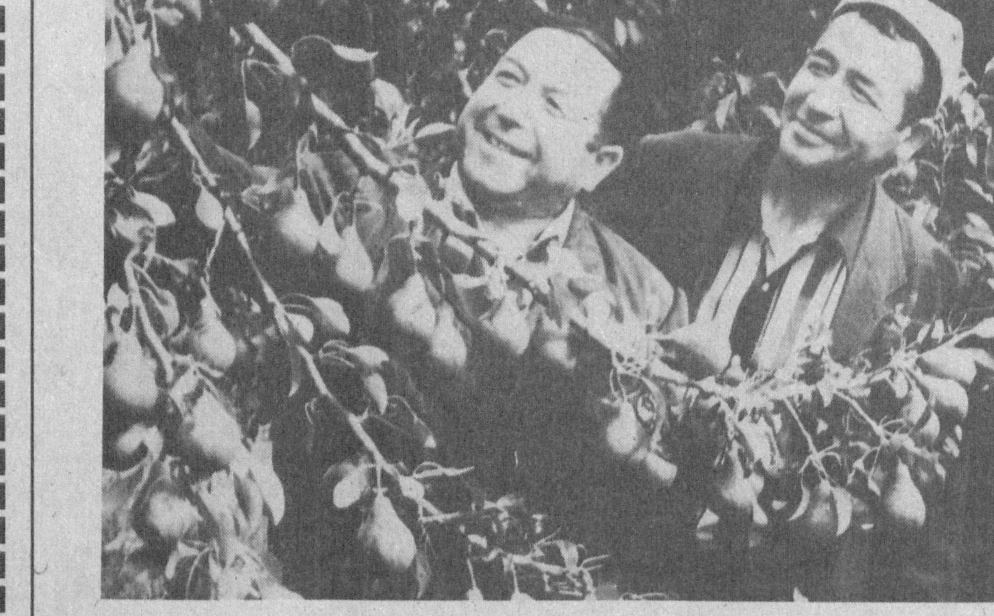
Янгиқўрғон туманидаги «Кўкёр» ширкат ҳўжалиги боғдорчилик ва сабзавотчиликка ихтисослашган. Бу ерда боғ-роғлар ижарачилар ихтиёрига берилган. Натижа чакки эмас. Экинлардан юқори ҳўсил олинмоқда. Бу йил деҳқонлар 4120 тонна мева, 4700 тонна сабзавот етиштиришни кўзлаганлар.