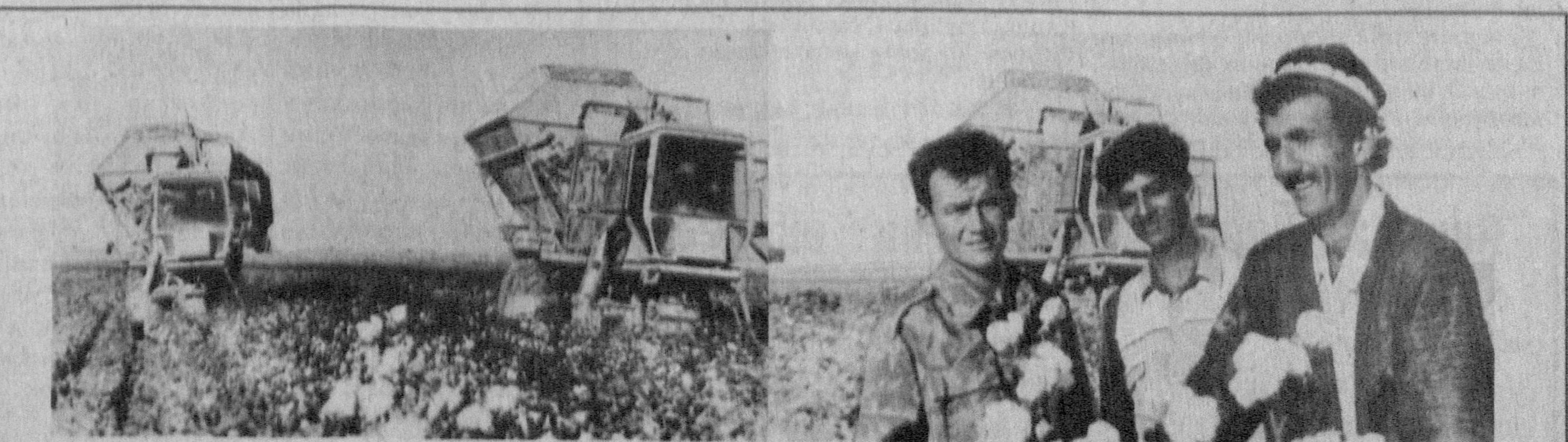
Нишон туманидаги Абдулла Қодирий номли жамоа шир- кат ҳўжалигида механизацияга катта эътибор берилляпти. Шу боис пахта йиғим-теримида жадал сурьатта эришил- моқда.