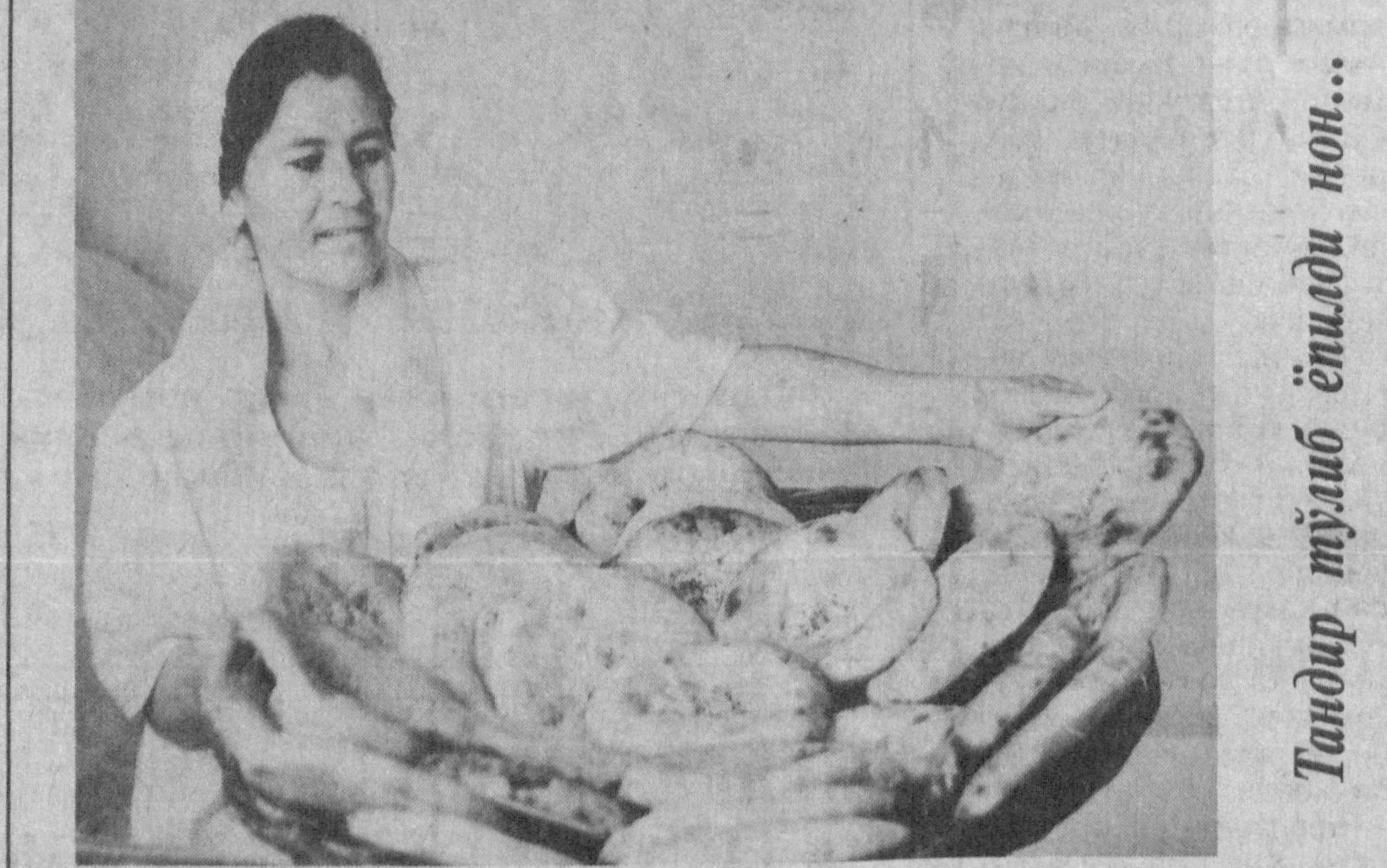
Тандир тўлиб ётиди нон...

«Ойланг неча киши? - яна сўрайди шоҳ. - Йилгирча киши, - дейди шоир. - Сен мена билан қолганинг керак. Самарқандга эса икки минг руийи жунатамиз. Бу сенин оиланг учун, токи уларни бу ерга, сенинг қошингга қучириб келгунарчига этиб туради, - дейди шоҳ. Аммо Муҳрибий сўзидан туриб олади. Шоҳнинг кайфияти бузилади ва: - Сен бизни мажбур қилиб, кетишинга руҳсатнома олмақчисан. Нима ҳам қилдик, биз ҳам бировни мажбур қилиб олиб қолишни истамаймиз. Шоҳ шундай деди-ю, газабноқ кузларини қўли билан тўсиб, имо-ишора билан кетишга руҳсат қилади. Ҳа, шоир Муҳрибий учун подшоҳлар марҳаматидан ўз ватани аълоқ эди. Биз ватанпарвар аждодимиз Муҳрибийга яратган раҳматлар ва бу воқеани ўзининг «Тарихдан сабоқлар» китобида дарж этган олиму Бурйоби Аҳмедовга марҳамат тилаб ҳикоямизни яқунлаймиз. М.ХУДОЙҚУЛОВ.