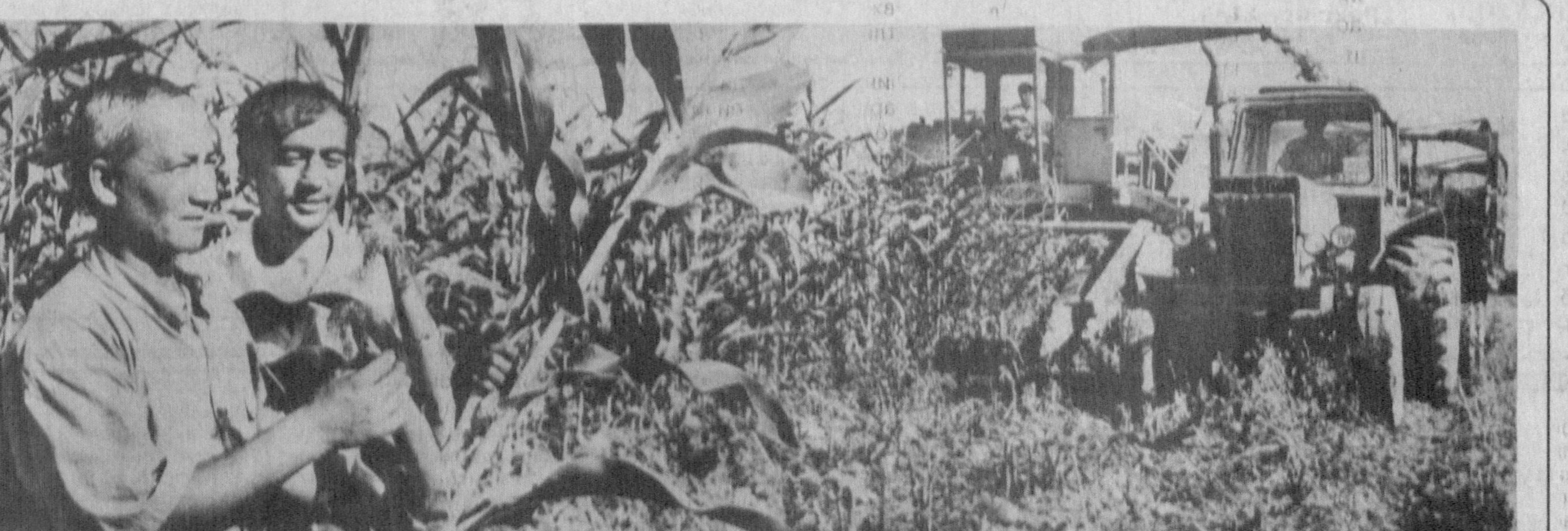
Уйчи туманидаги «Зарбдор» жамоа ҳўжалиги аъзолари галлани йиғиштириб олишгач, бўшаган майдонларга пешма-пеш маккажўҳори дони қаддашди. Экин яхши парвариш этилгани туфайли урроқа келди. Ҳозир ҳўжалик деҳқонлари ҳар гектаридан ўртача 200-250 центнердан кўк озуқа йиғиштириб олишмоқда.