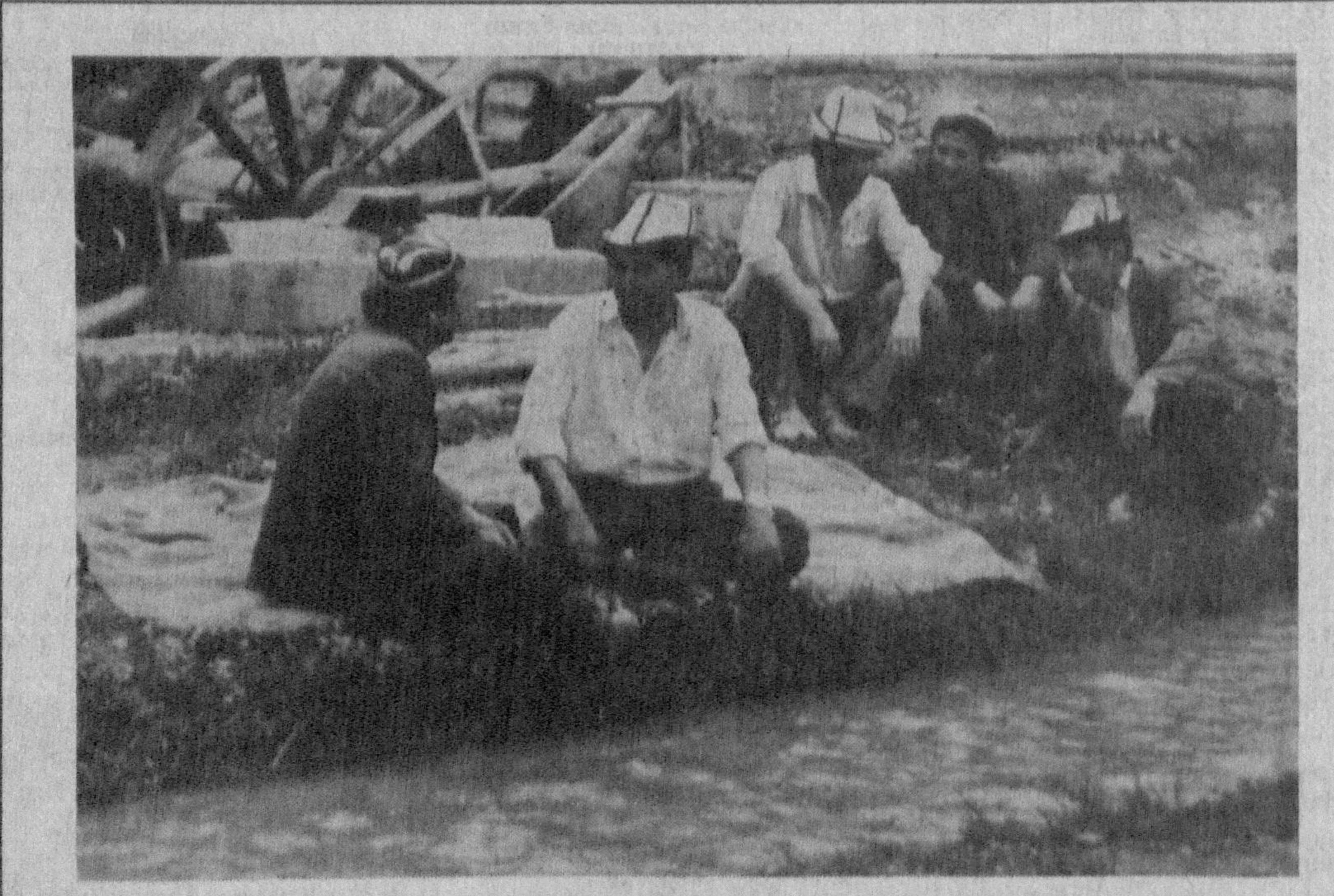
Ён қўшни — жон қўшни.

Ҳа, сотувчи ҳақиқатан ҳам янглишмаган эди. У оддий табиий қанд эди. Бундай қандга ҳозир Европада талаб катта. Рангли қандни тайёрлаш ҳараёни оддий. Қанд доналари ўтадиган тасмаларга ўз таркибидан инсон учун фойдали бўлган 200 га яқин бирикмаларнинг суолтирилган юзгангина қилиб суртлади. Қарабисизки, рангли қанд тайёр. Унинг устига у оқ қандга қараганда анча фойдали.