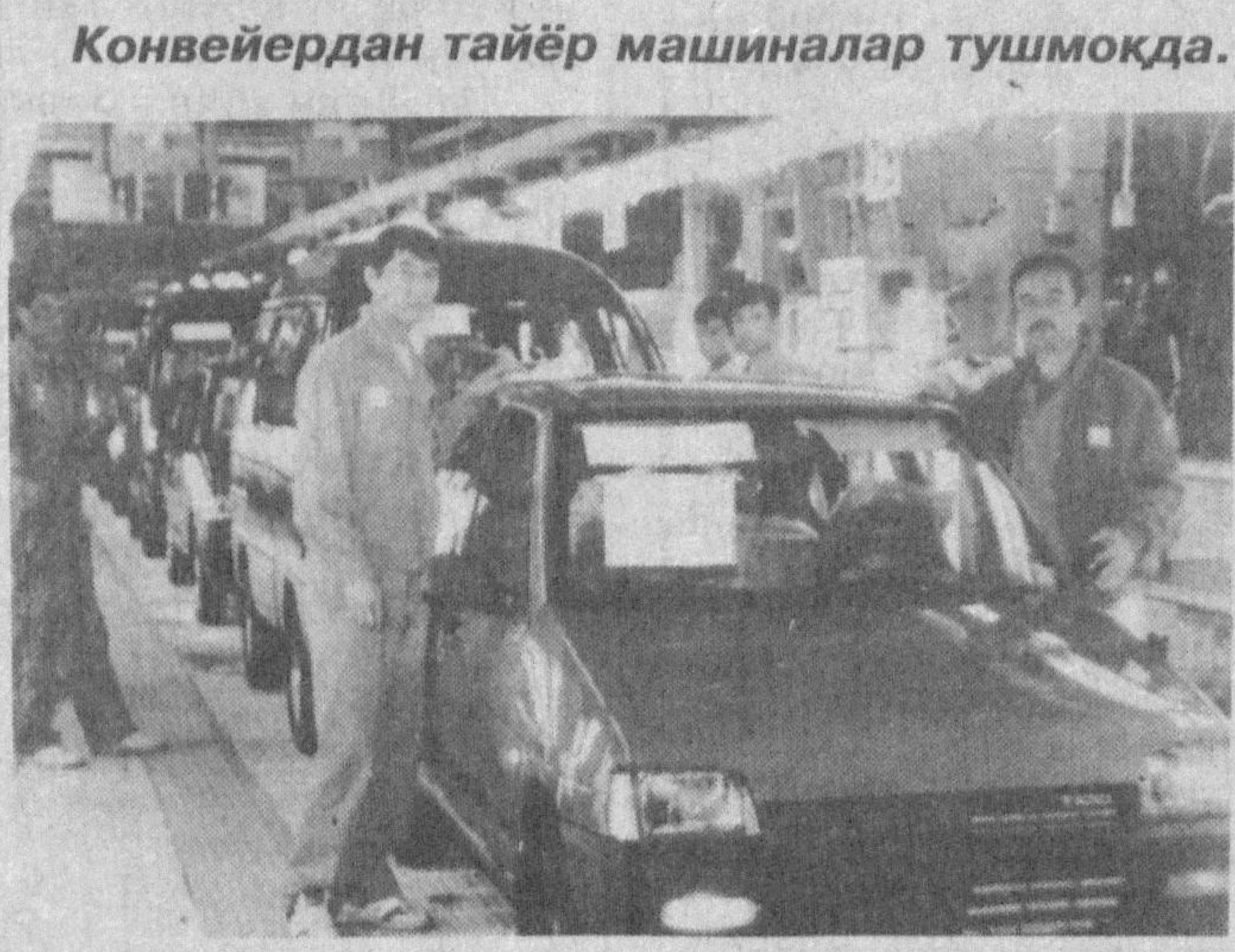
Конвейердан тайёр машиналар тушмоқда.