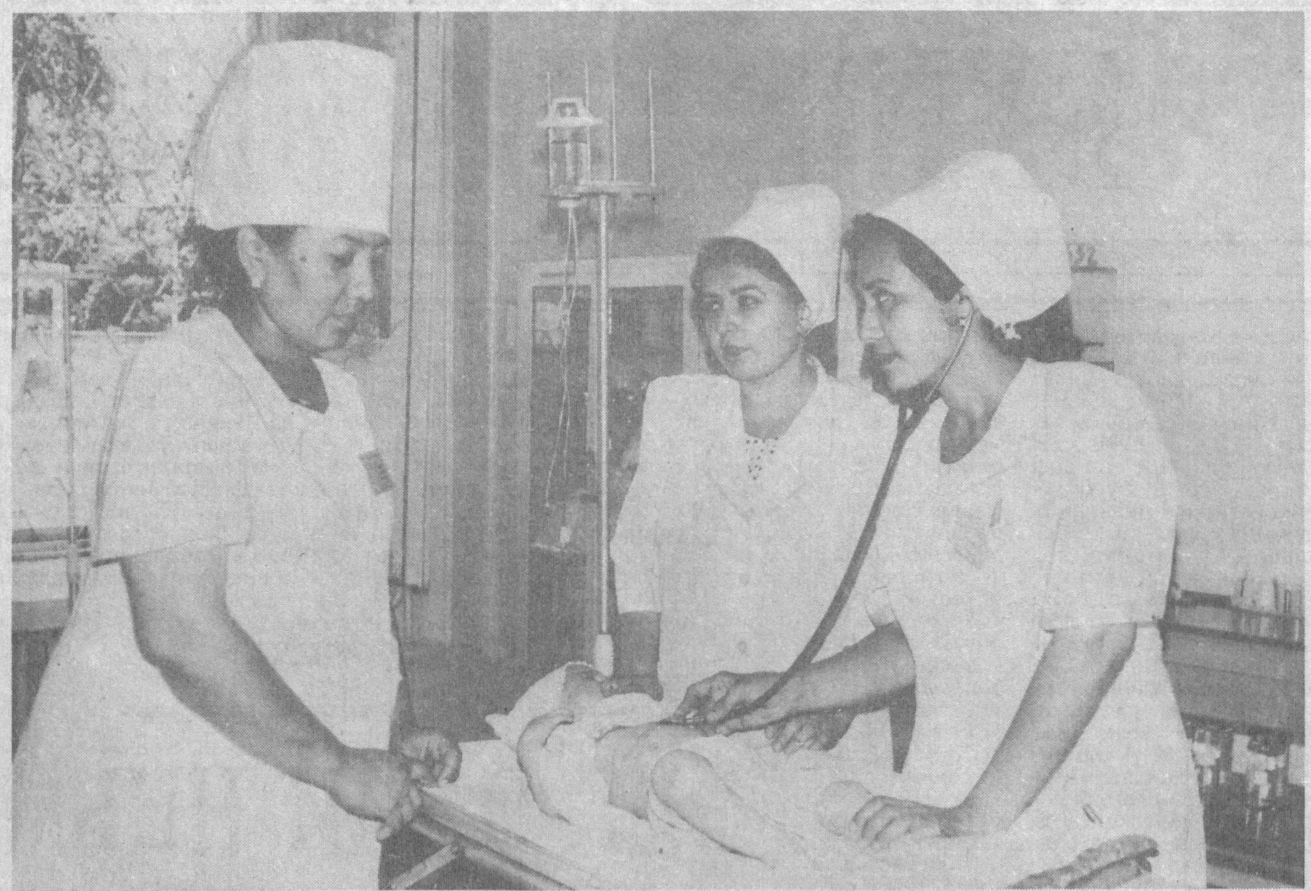
Ўзбекистон Конституциясининг 40-моддасида шундай дейилади: «Ҳар бир инсон малакали тиббий хизматдан фойдаланиш ҳуқуқига эга».

Мухаббат ўРМОНБЕКОВА, «Ишонч»нинг махсус муҳбири.