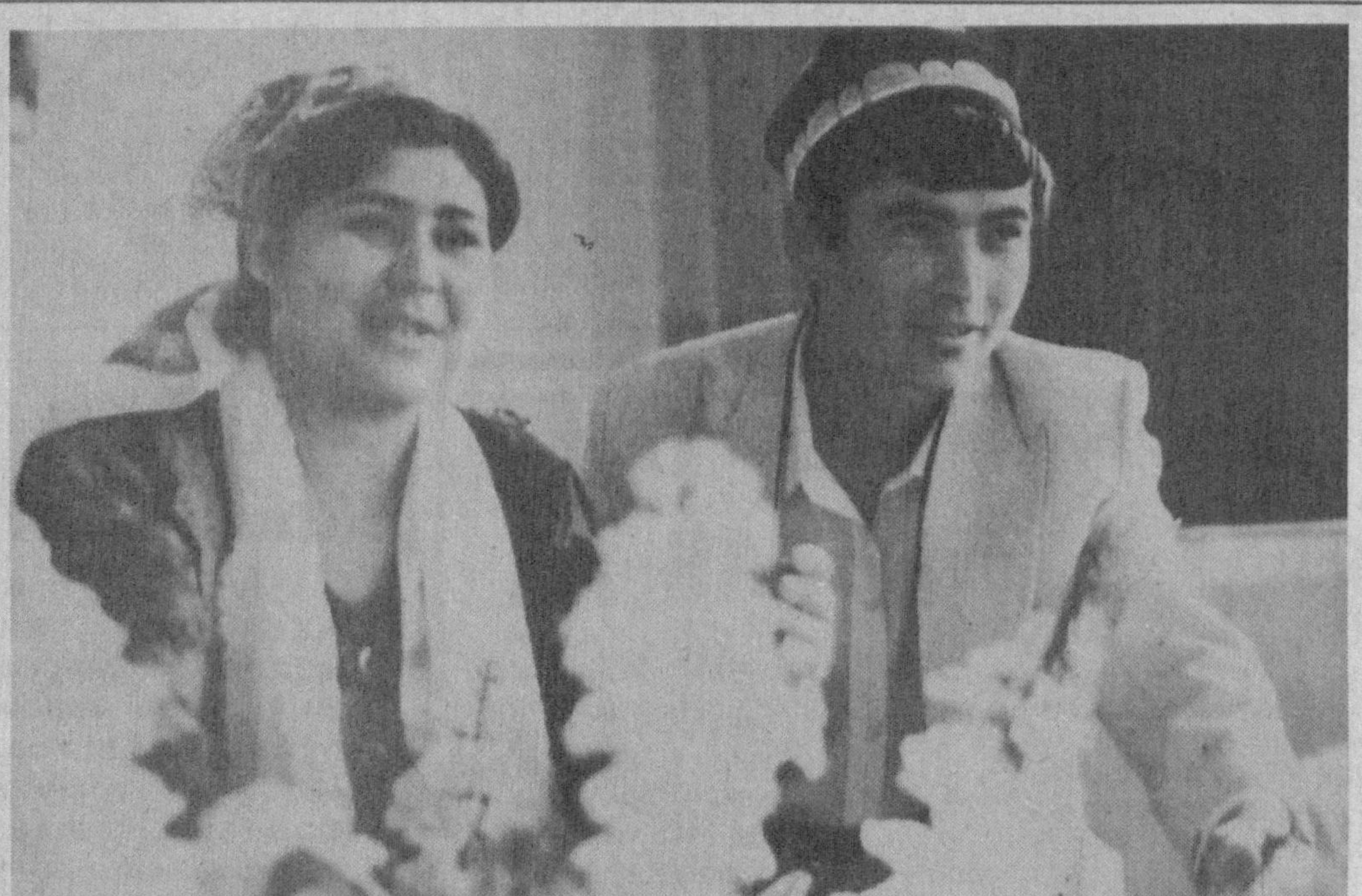
Балиқчи тумани ҳокимилиги тadbиркорлар, ишбилармонлар, фермер ҳўжалиги ҳамда кичик корхоналарга амалий ёрдам бериб келмоқда.

«Ишлаб чиқаришнинг мураккаб жиҳатлари асосан, таъминотчи, хизмат кўрсатувчи шерикларга боғлиқлиги бор, - дейди Р.ҚУРБОНОВ, «Ишонч» мухбири.