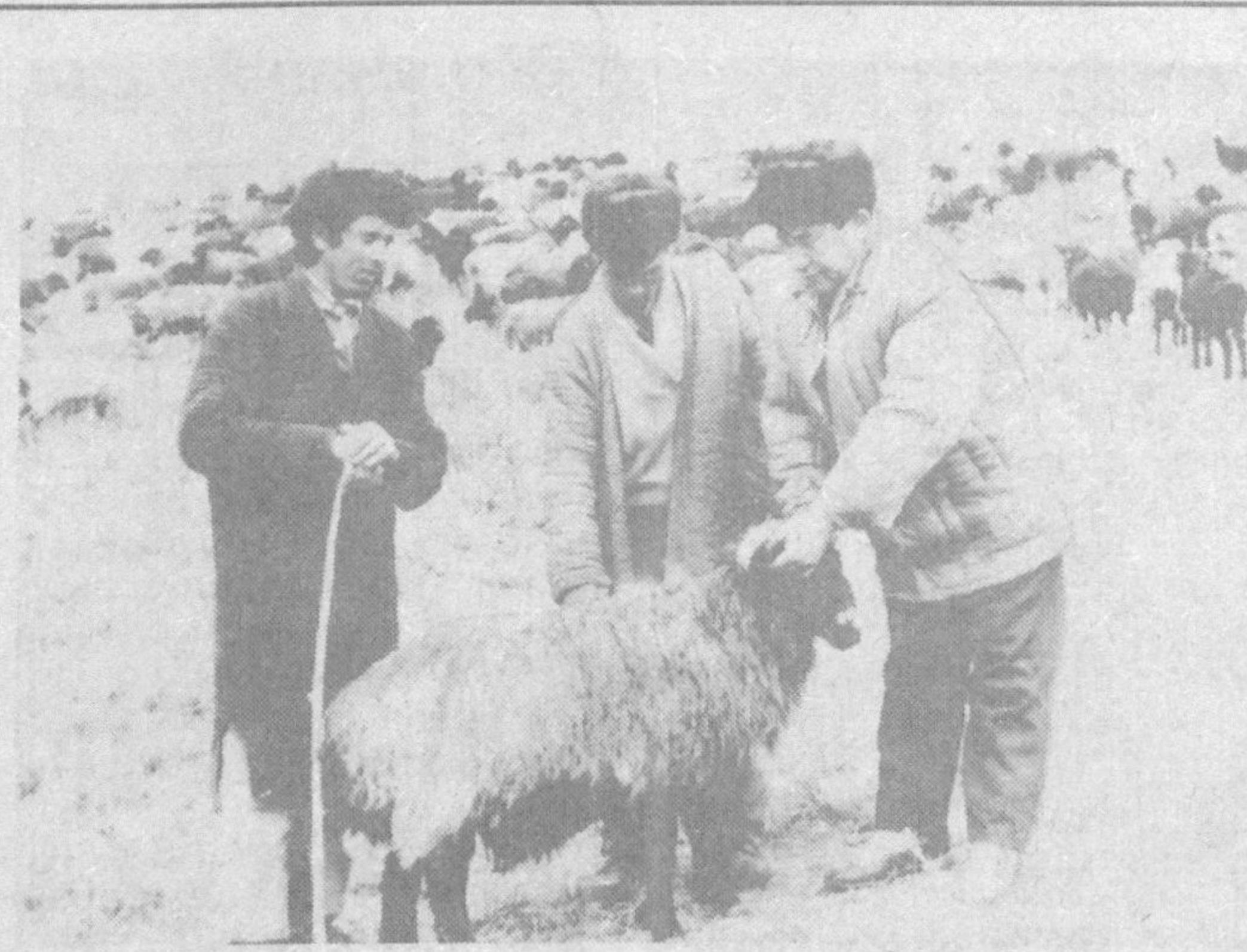
Кўйчилик - чорвачиликнинг муҳим соҳаси ҳисобланади. Буни яхши тушушган чўпонларимиз кўйлар туёғини кўпайтиришга ҳаракат қилишмоқда. Айни чоғда республикамизнинг аксарият чорва фермаларида қишга тайёргарлик йомушлари ниҳоясига етказилди. Ем-ҳашаклар имкон даражасида йиғиб олинди. Бироқ ҳо-

зир кун анча илиқ бўлганлиги боис, чўпонларимиз кўй-кўзиларни яйловларда боқишмоқда. Бу эса ўз навбатида заҳирадаги ем-ҳашакларни тежаш имконини бераётир.