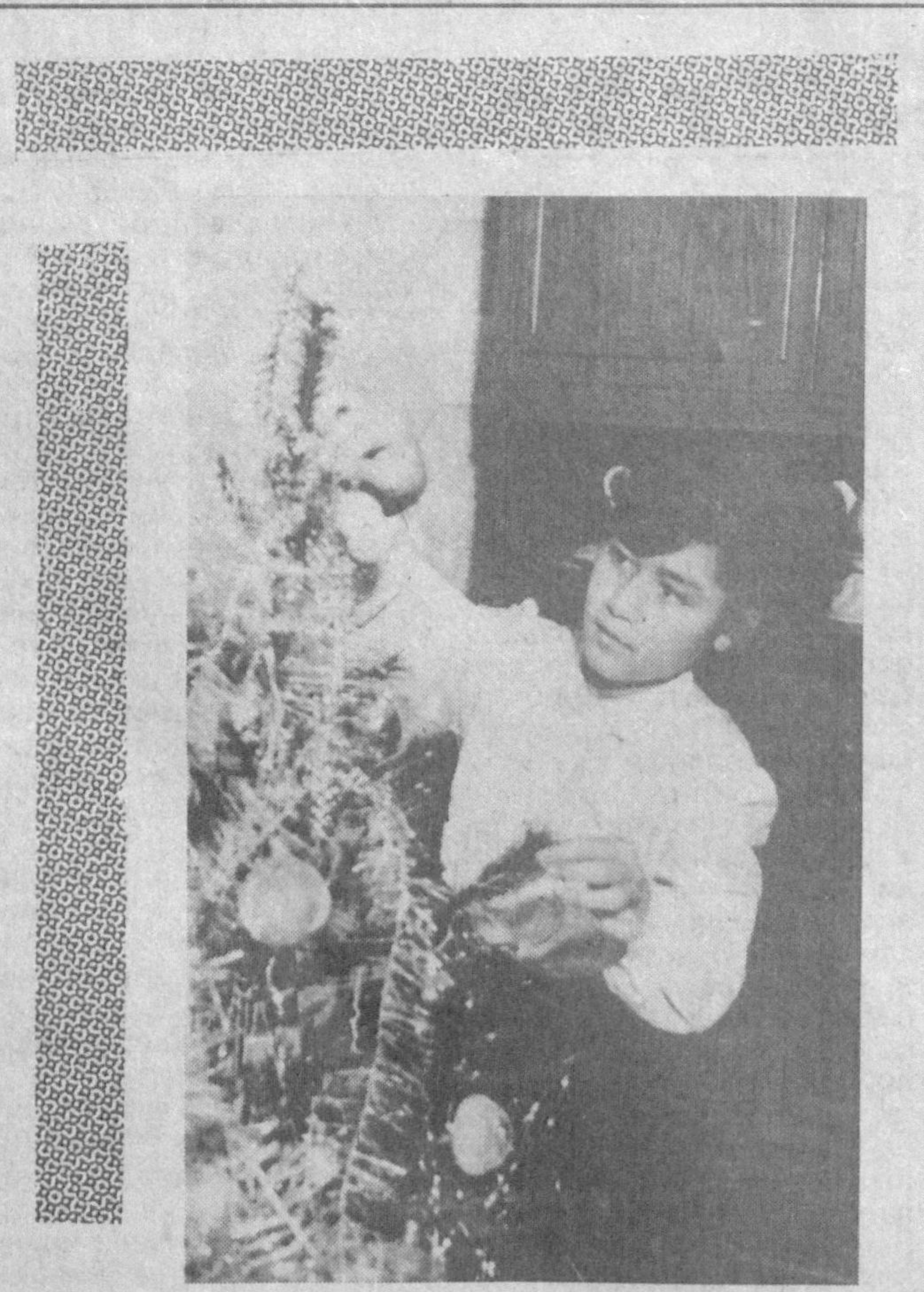
Онамларга тортиқ деб севиш Безатдим арча. Янги йилда бўлсин олам тинч, Шод-хуррам барча.