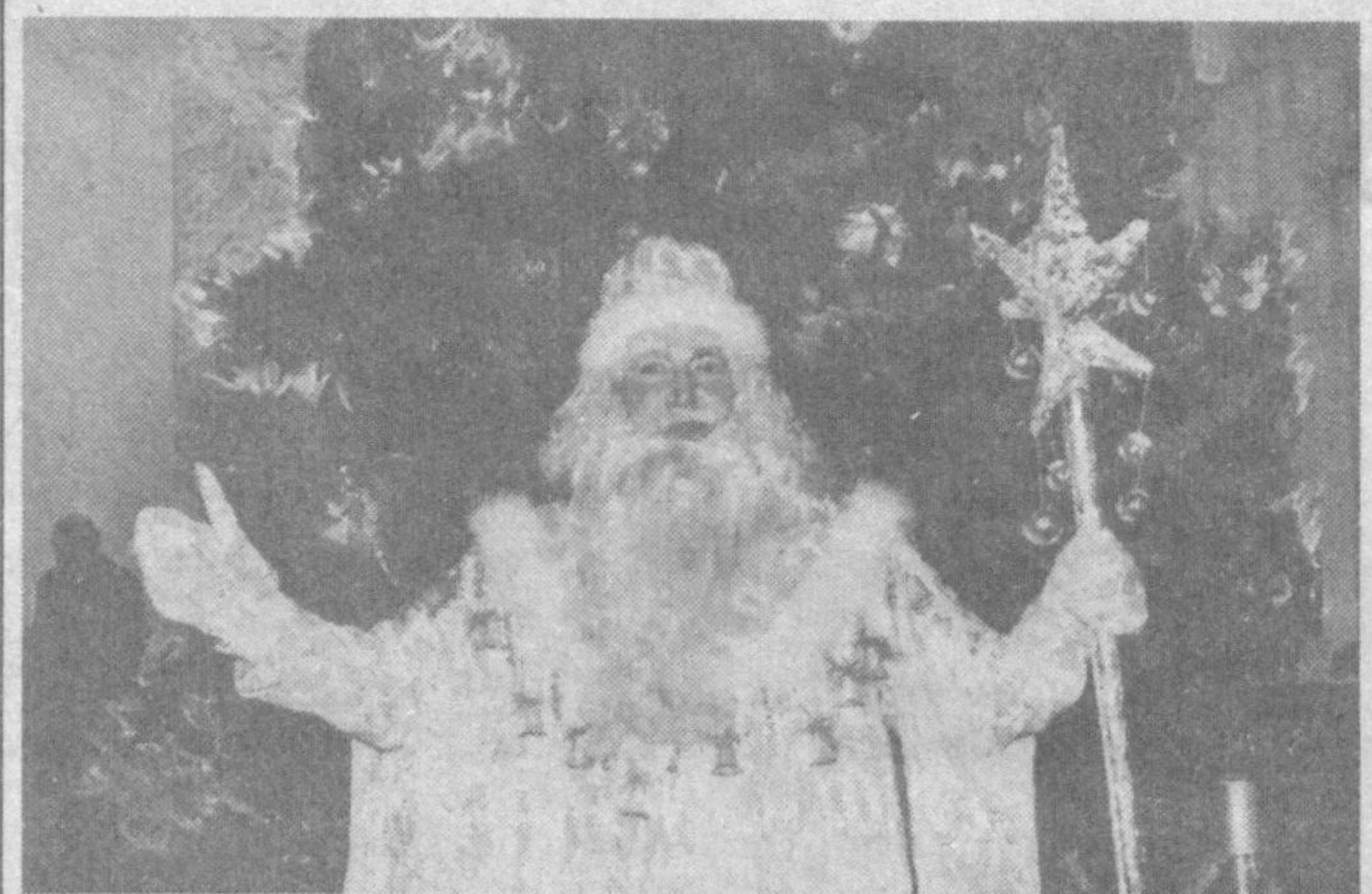
Истайманки, улашилсин Болаларга йил буйи Бир совға, у туташ бўлсин — Истиқбол-иқбол куйи.