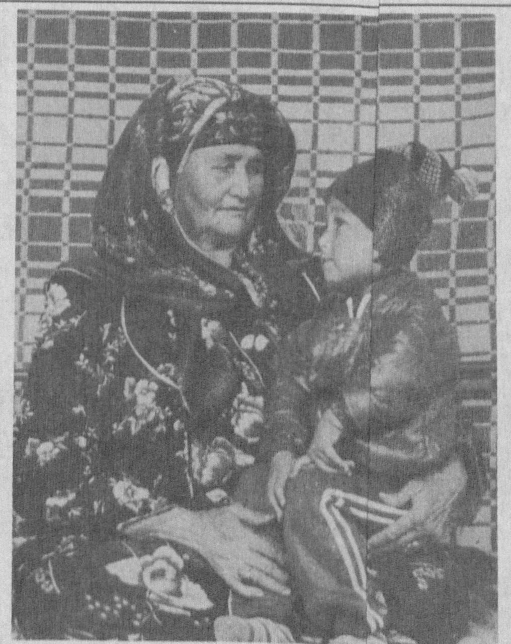
Сен биздан ҳам ақли, бахтли-содатли бўласан, болам!

Муллайти Тошмуҳамедов нои Қашқадарё мусиқали ма театрида ҳам байрадабири ўтка-зилди. У «Меҳрибон-лик уйлари» тарбияла-нувчилар эҳтижманд оилаларни фарзандла-ри, ногўи болаларга мамлакатиз Президентининг янгий совғаларини врят ҳокими Ш.Бегматтопширди.