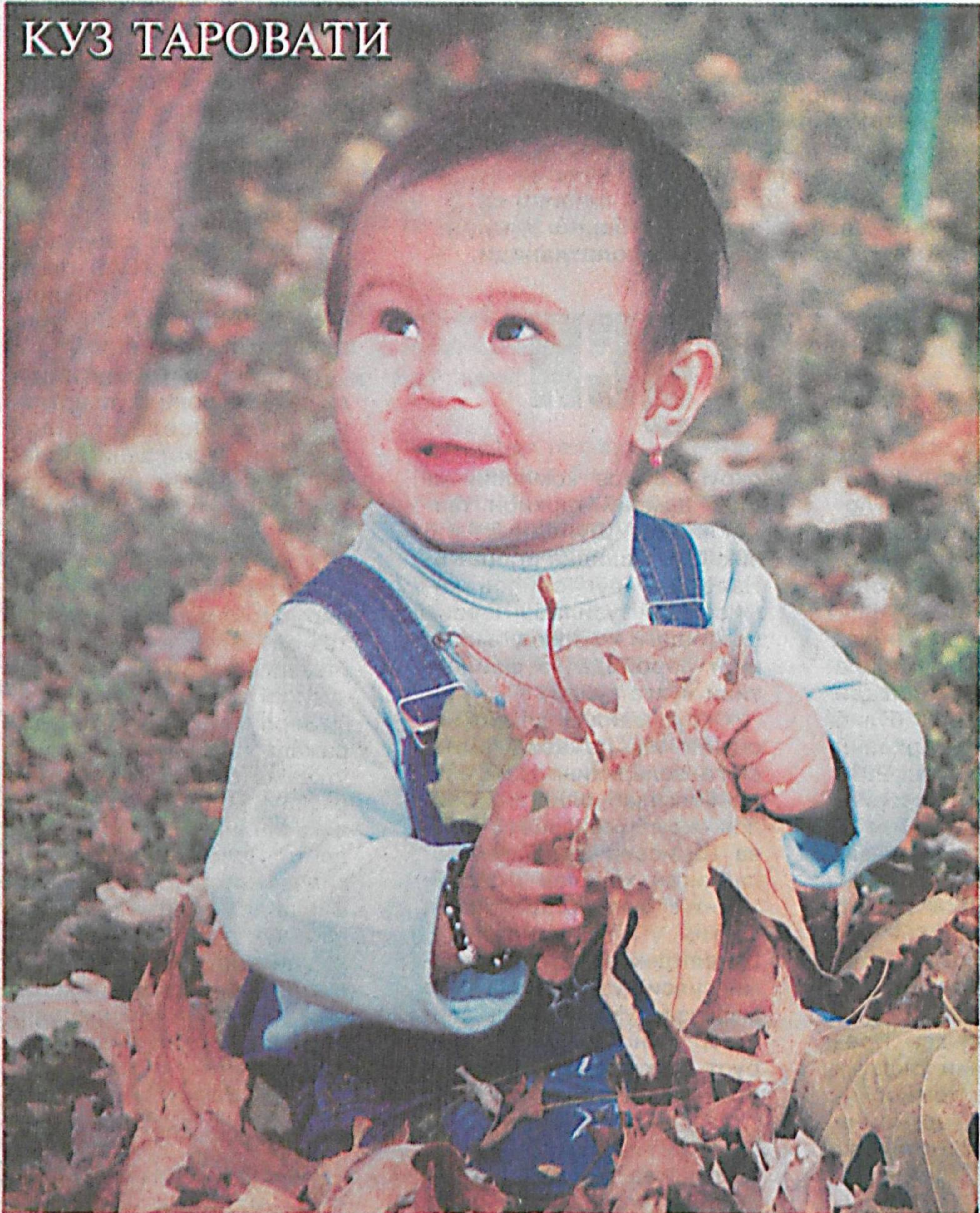
Икром ХАСАНОВ оғани суратлашди.