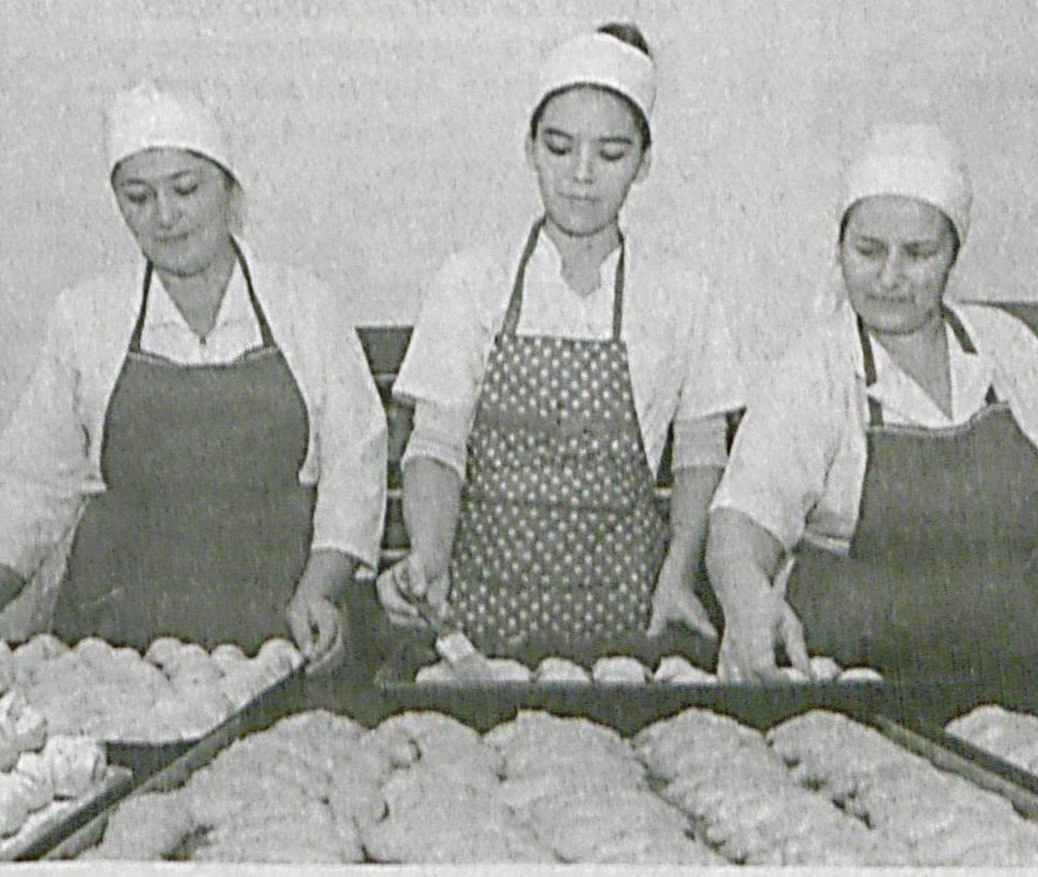
Навоий шаҳридаги «Favorit lyuks servis» масъуляти чекланган жамиятида тайёрланаётган нон ва қандолат маҳсулотларига талаб ортмоқда.

2013 йили 8 ишчи фаолият бошлаган қорхонада бугунги кунда улар сонин 40 нафарга етди. Айни пайтда бу ерда кунига 3 ярим тонна ун қайта ишланиб, 200 турдаги нон ва қандолат маҳсулотлари ишлаб чиқарилмоқда. Сифатли ва мазали маҳсулотлар савдо дўконларига, бюртмачи ташкилотларга пешма-пеш отқазиб берилмоқда.