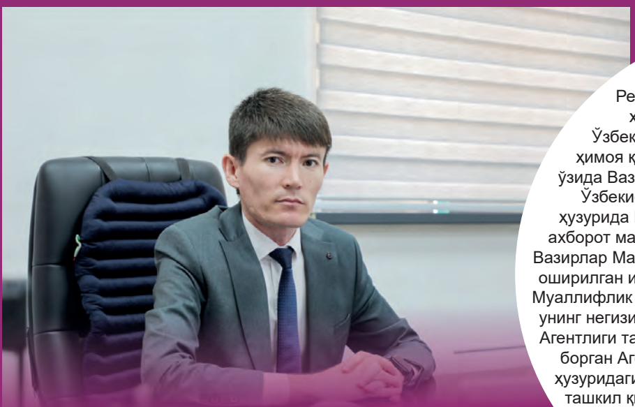
Сардорбек Қиличев, Адлия вазирлиги Интеллектуал мулкни рўйхатга олиш ва ривожлантириш бошқармаси бошлиғи: