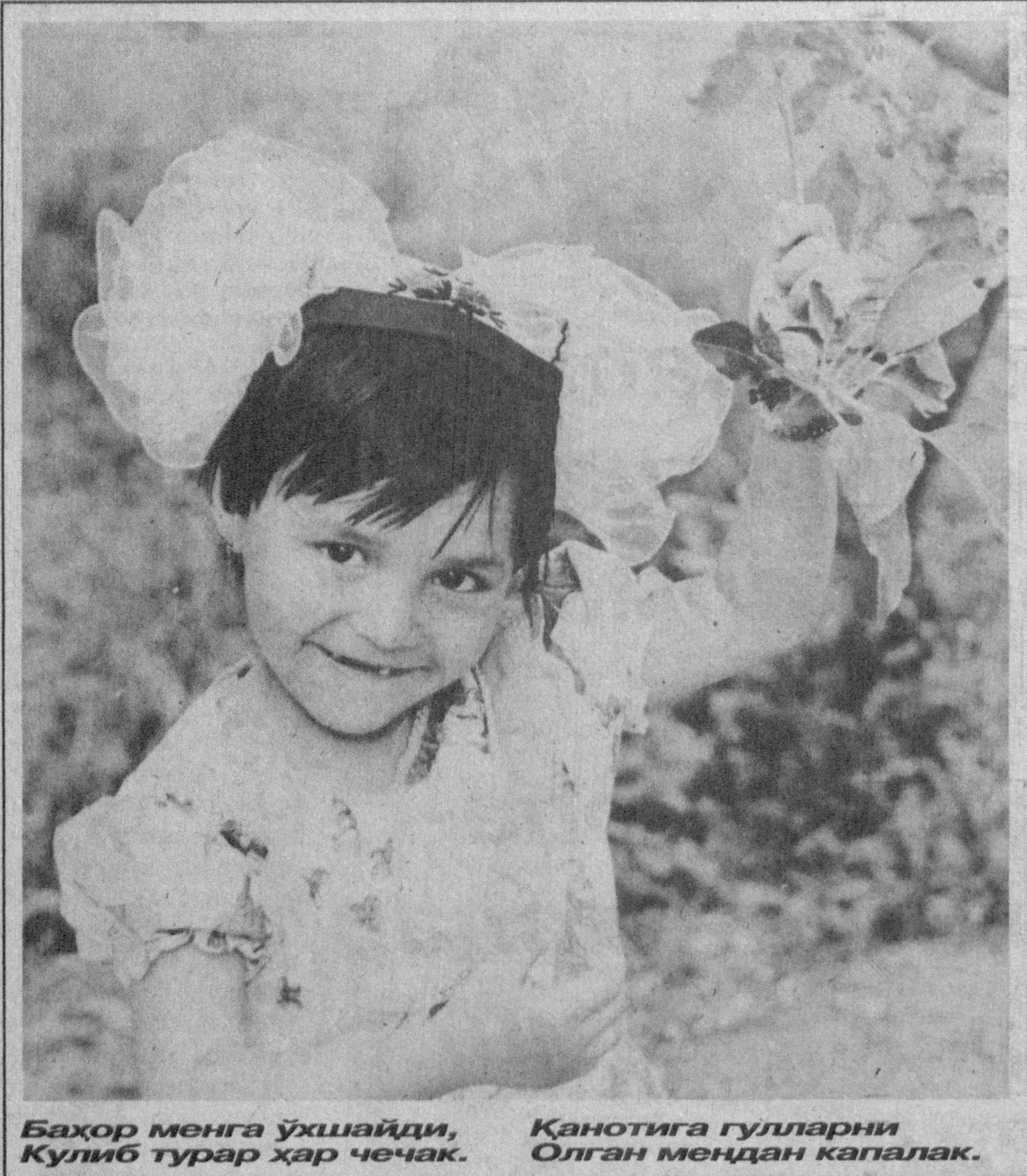
Баҳор менга ўхшайди, Кулиб турар ҳар чечак.