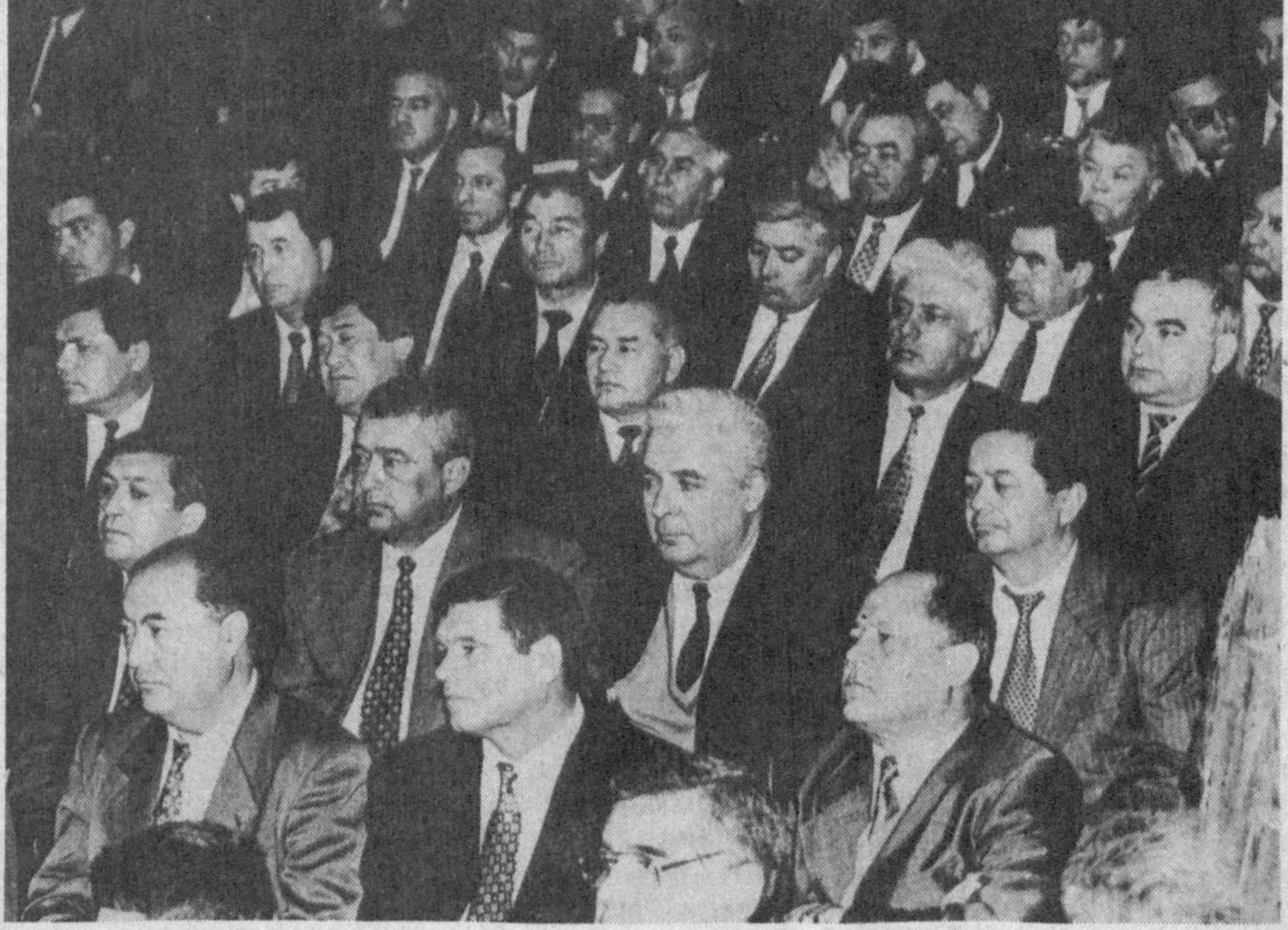
Суратда: Сессия пайти.