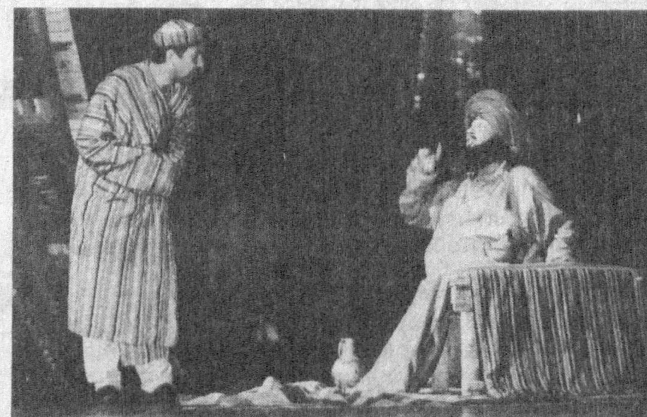
Аброр Ҳидоятлов номидаги театрда сахналаштирилган «Судҳур» спектаклидан лавҳа