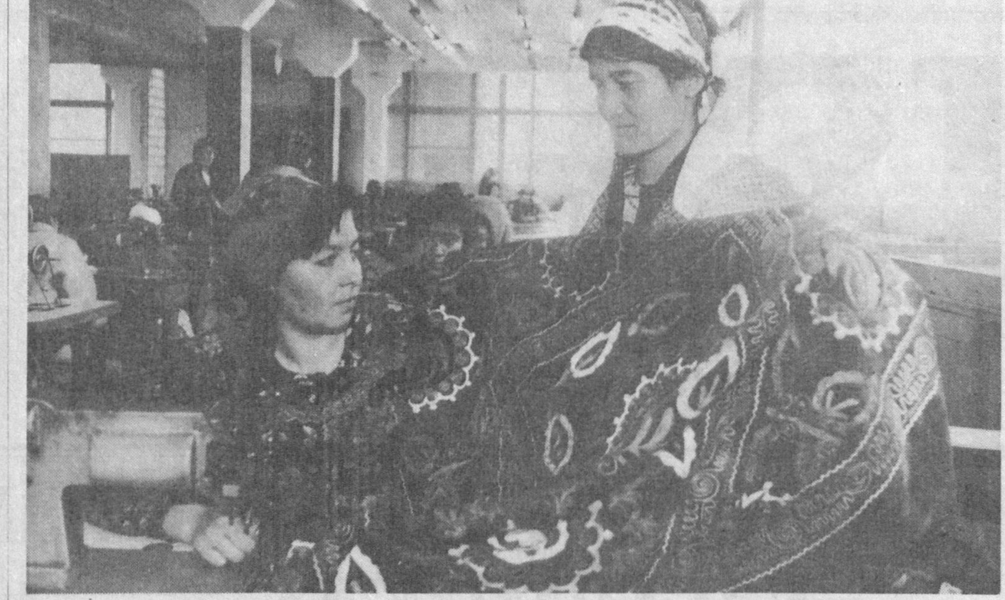
Бугунги кунда Шахрисабздаги «Хужум» бадий буюмлар жамоа корхонасининг доврўғини республикамиздан ташқарида ҳам яхши билишади. Корхонада ишлаб чиқарилаётган миллий услубдаги амалий сир-асорларни сифатлиги ҳамда харидорлиги билан тармоқ корхоналари орасида ажралиб туради.

Хуқуқшуносликда икки хил муҳим қоида мавжуд: бири - «фақат руҳсат этилган фаолият билан шугулланиш мумкин», иккинчиси