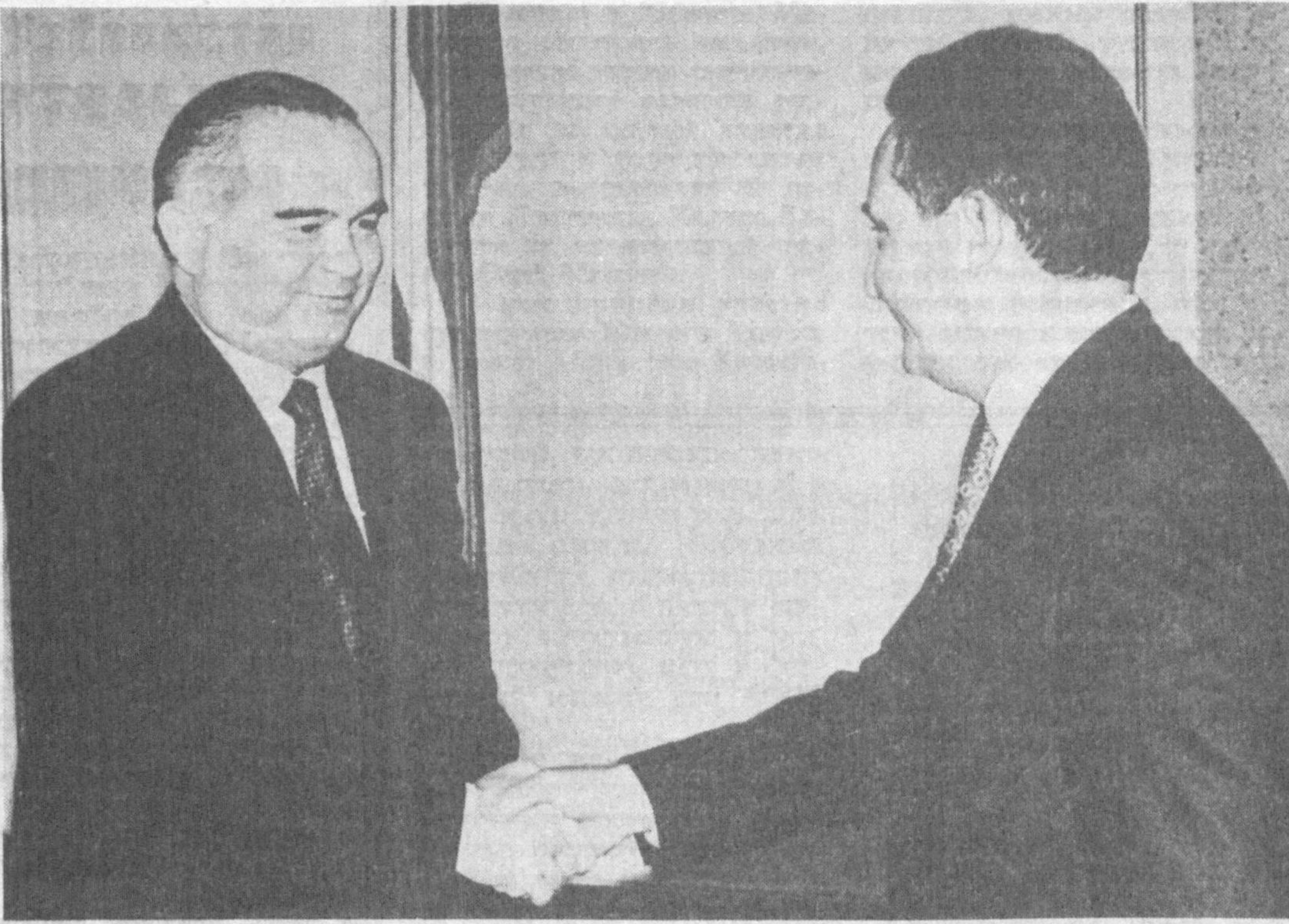
Суратда: Қабул пайти.

Давлатимиз раҳбари меҳмонни юртимизга ташрифи билан қутлар экан, Ўзбекистонда мазкур ташкилотнинг дунё халқлари маданияти, тарихи, миллий мероси ва маданий бойликлари асраб-авайлаш, бир-бири билан таништириш борасидаги аҳамияти юксак қадрлашганини таъкидлади.