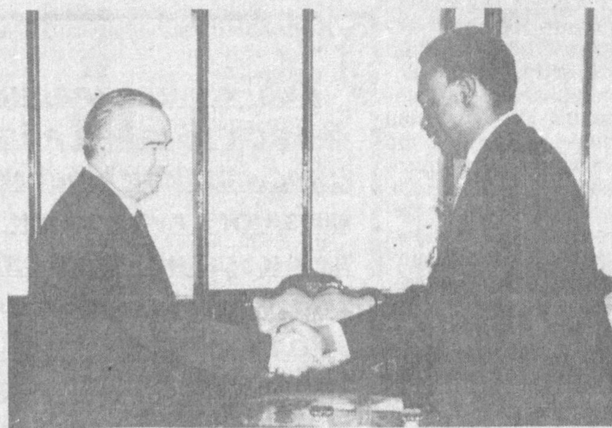
Суратларда: Ишонч ёрлиқларини топшириш пайти