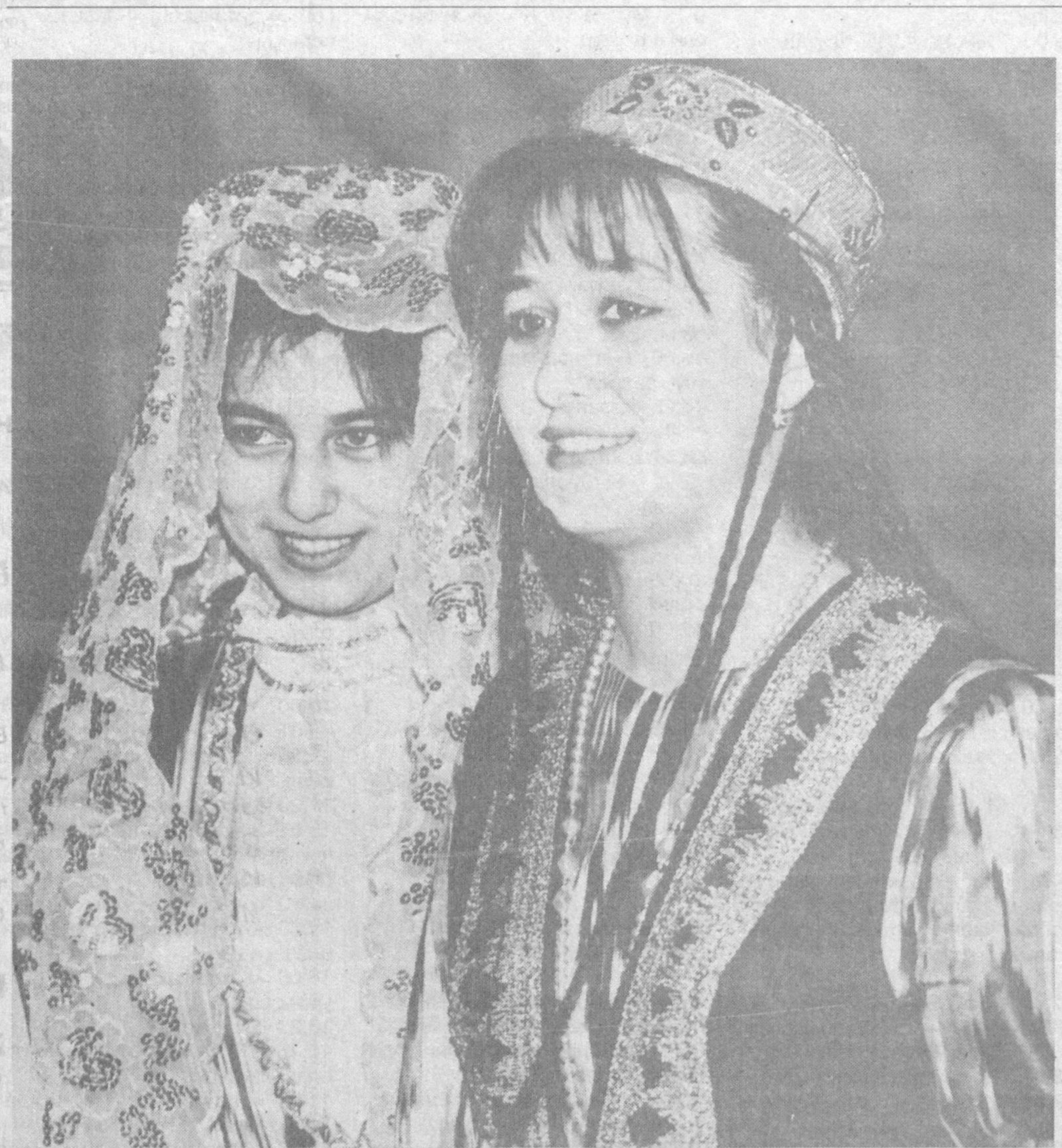
Соҳларим толим-толим, Майдалаб ўрай, дейман. Бахти кулган элимнинг Иқболини кўрай, дейман.