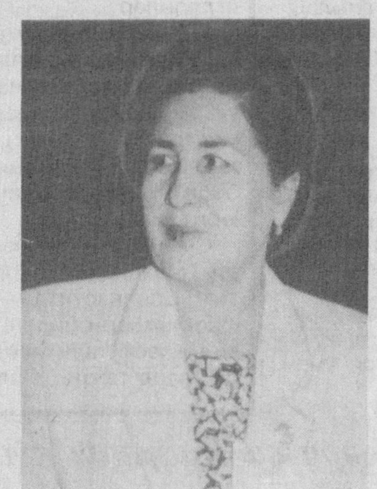
Дилбар ГУЛОМОВА, Ўзбекистон Республикаси Бош вазири ўринбосари, Республика хотин-қизлар кўмитаси раиси

Мамлакатимиз Президентининг Ўзбекистон Республикасида аёлларнинг давлат ва жамият қурилишидаги ролини ошириш ҳақидаги фармонидан кейин умри азизларга бўлган муносабат тубдан ўзгарганлигини дилдан ҳис қилмоқдамиз. Ҳукумат доирасида аёллар масаласи бўйича махсус Концепция ишлаб чиқилди. У хотин-қизларнинг ҳақ-ҳуқуқларини ҳимоя қилишнинг программ ҳужжатига айланди. Ўзбекистоннинг ўзига хос томонлари ҳамда мавжуд муаммолар ҳисобга олиниб ана шу Концепция асосида махсус дастур ишлаб чиқилган. «Аёллар меҳнатини ижтимоий ҳимоялаш», «Экология ва аёл», «Аёл, оила, маҳалла», «Соғлом авлод-кучли жамият асоси» кабилар шулар жумласидандир. Ҳозирги кунда жойлардаги аёллар кўмиталари ушбу йўналишда хайрли ишларни амалга оширишляпти. Мустақиллик шарофати тўғрисида аёллар мавқеи, хурмати тобора ортиб бормоқда. Кувончли шуки, Олий Мажлис депутатларининг йигирма бир нафари аёллардир. Бозор шароитида Ўзбекистон ижтимоий ривожланиш масалаларини ҳал этишнинг ўзига хос модулига эга. Ҳаёт у нақадар тўғри эканини қайта-қайта тасдиқламоқда. Бу ўтиш даврида жамиятда оммавий ишсизлик, муҳтожлик каби кўринишларнинг олдини олишда муҳим аҳамият касб этмоқда. Ҳукуматимиз иқтисодий бариқор ривожлантиришга эришмоқда. Халқаро семинарда алоҳида таъкидлашни истардим: