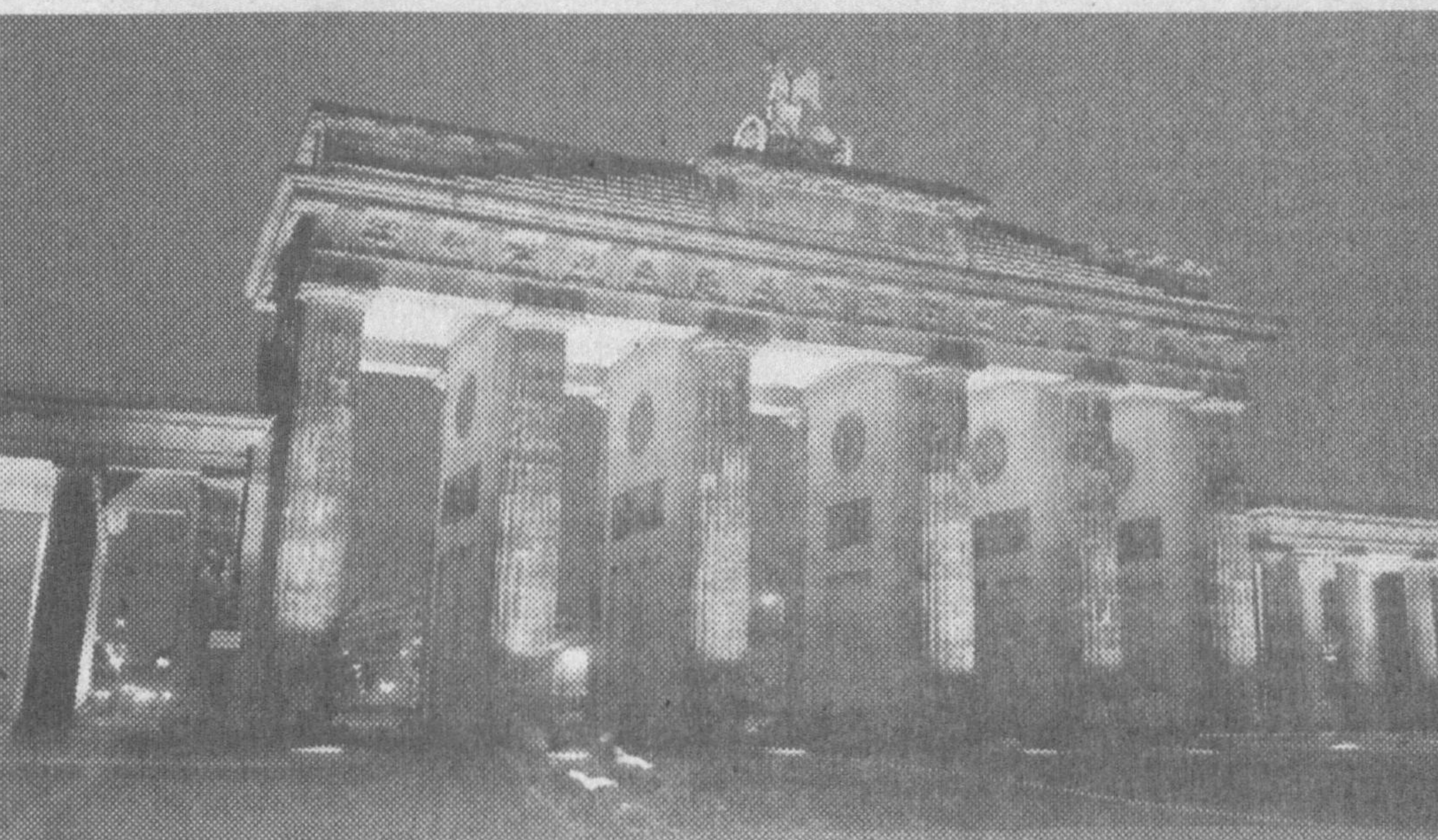
Берлиндаги Брандербург дарвозаси

оранжерияларида ер шарини турли бурчакларидан келтирилган тропик ва субтропик минтақаларига хос ўсимликларнинг 800 дан зиёд турлари ва навларни етиштирилмоқда. Биологик майдонда ўсимликларнинг турли ҳаётий шакллари билан танишиш имкони яратилган. Шу майдонларнинг ўзида интродукция қилинган ва иқлимлаштирилган дарахт ва буталарнинг камб ва қимматбахо тур ҳамда навлари уруғидан ёки пайвандлаш усуллари билан кўпайтирилади. Бу ерда ўсимликлар оламини,