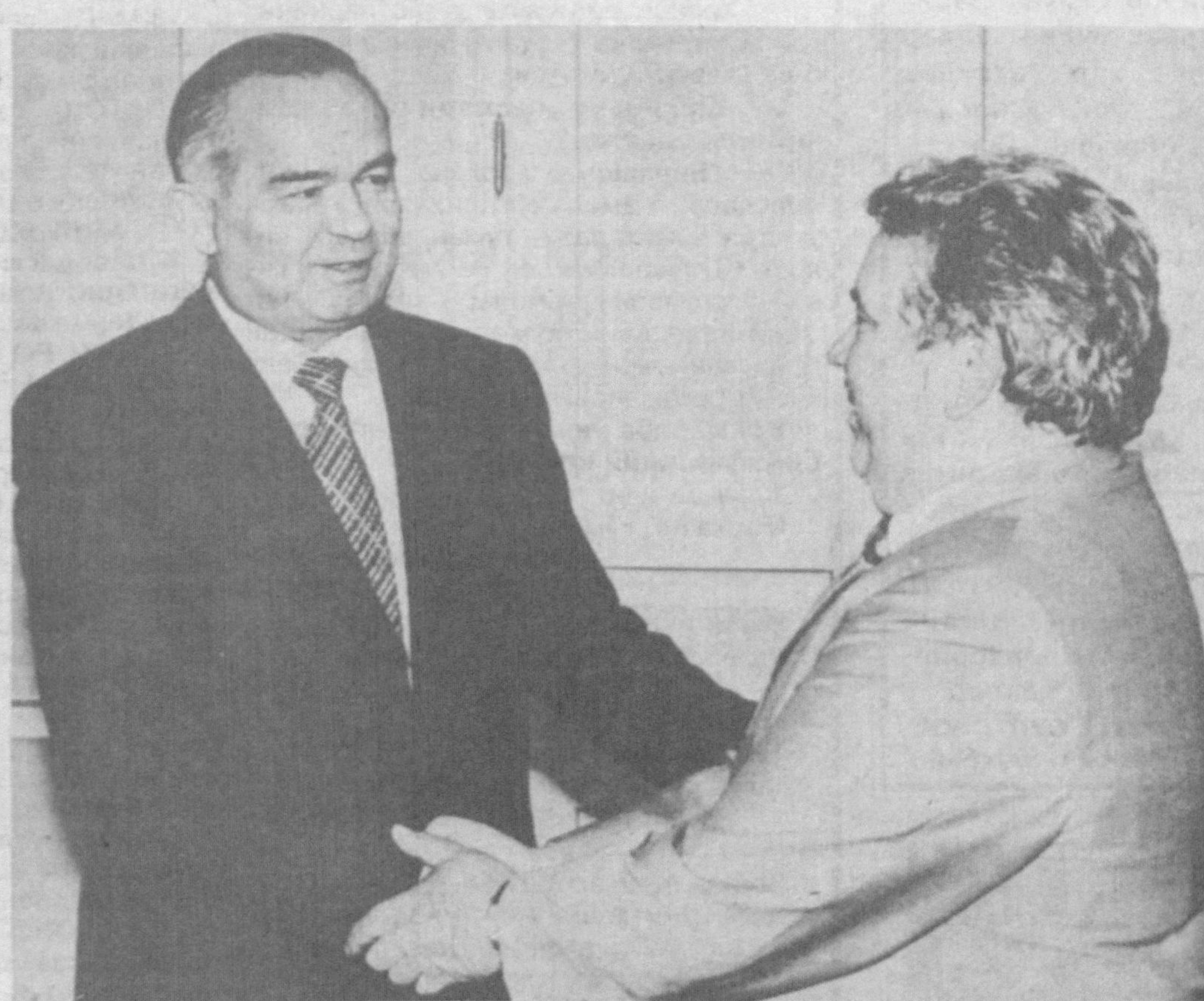
Суратда: Қабул пайти.

Ўзбекистон Республикаси Президенти Имом Каримов 27 май кунин Оқсарой қароргоҳида Россия Федерациясининг «Газпром» очик турдаги хиссадорлик жамияти бошқаруви раиси Рем Вяхиревни қабул қилди. Ўзбекистон нефт-газ саноати тараққиёти учун «Газпром» каби ташкилотлар билан мустаҳкам алоқа ўрнатиш муҳим аҳамият касб этади. Учрашувда бундай ҳамкорлик икки мамлакат ўртасидаги муносабатлар ривожига ҳам ижобий таъсир кўрсатиши қайд этилди. Сўхбат чоғида Ўзбекистон нефт-газ саноатида фаолият кўрсатувчи қорхоналар билан «Газпром» ўртасидаги ҳамкорлик масалалари юзасидан фикр алмашилди. Учрашувда «Ўзбекнефтгаз» миллий холдинг компанияси бошқаруви раиси И.Зайнутдинов иштирок этди.