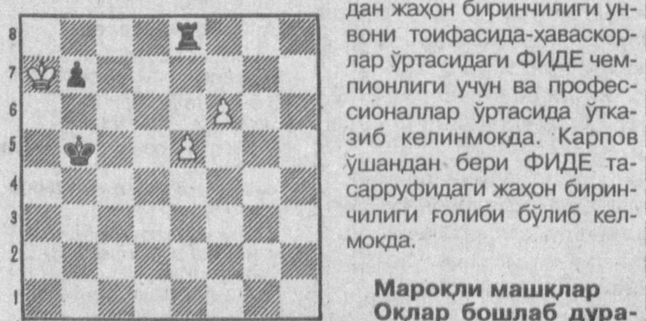
а б в г д е ф г ҳ

Навбатдаги саралаш мусобақаларининг голиби йи-