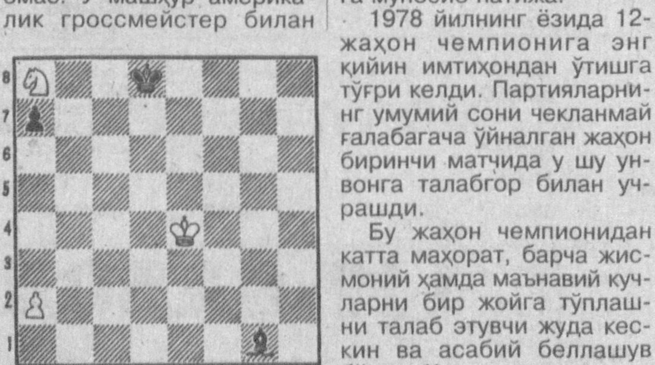
а б в г д е ф г ҳ

Карпов барабардек туюлувчи позицияларни ютиб чиқа оладиган ажиб қобилиятга эга. Манёврлар қилиш бобида унга бас келадиганлар қамдан-кам. У хиёлгина имкониятларни топиб, рақиби олдида янги вазифаларни қўйиб, ҳамма вақт уни та-