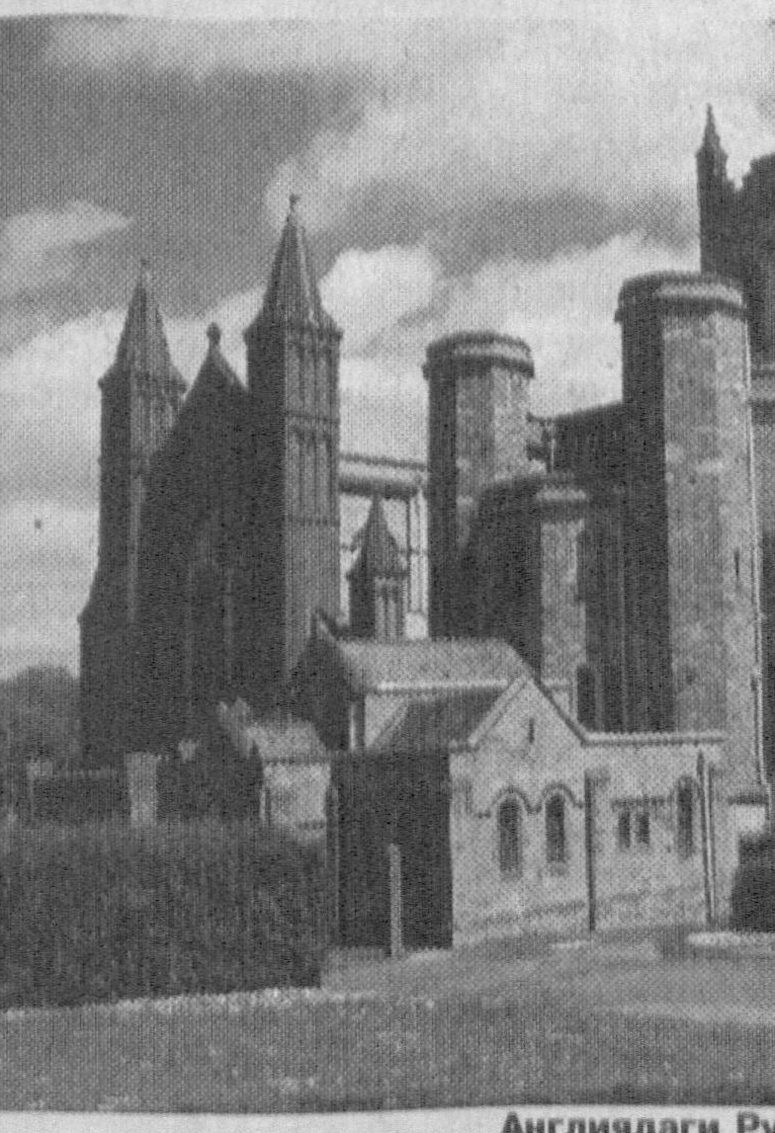
Англиядаги Рухонийлар Девоини