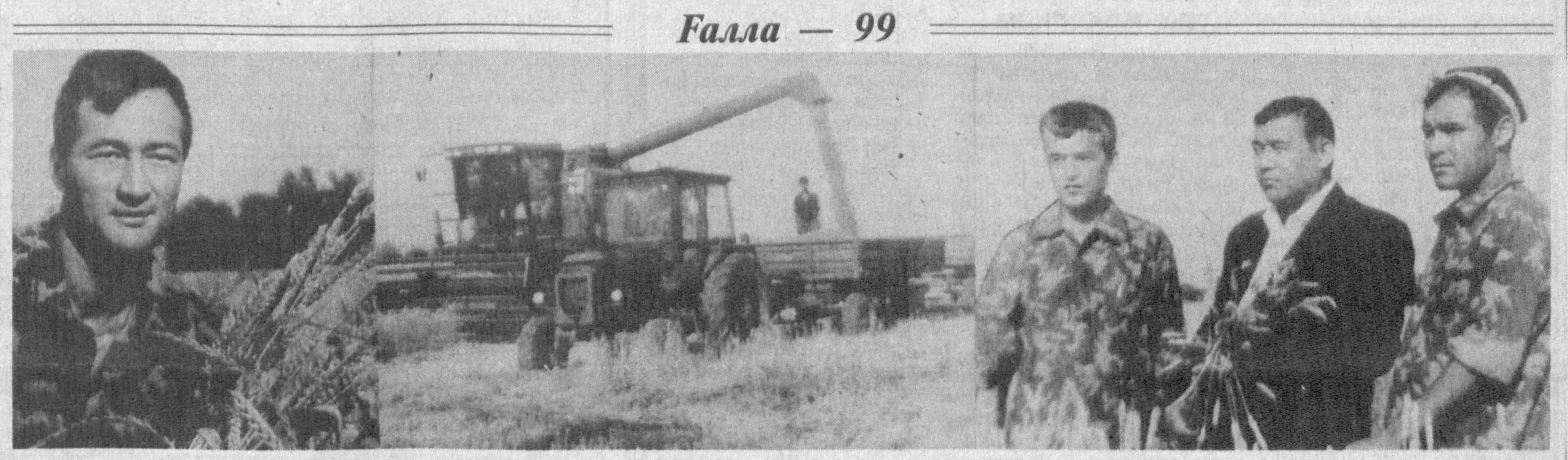
Галла — 99