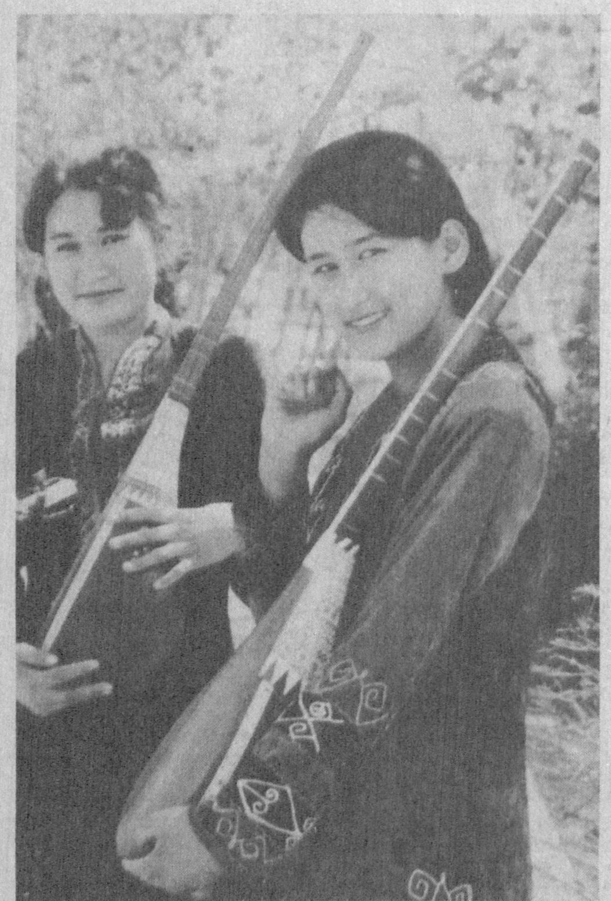
Мадхинга янгратай кўлдаги торим, Ифтихорим, шавкатим, она - диёрим.