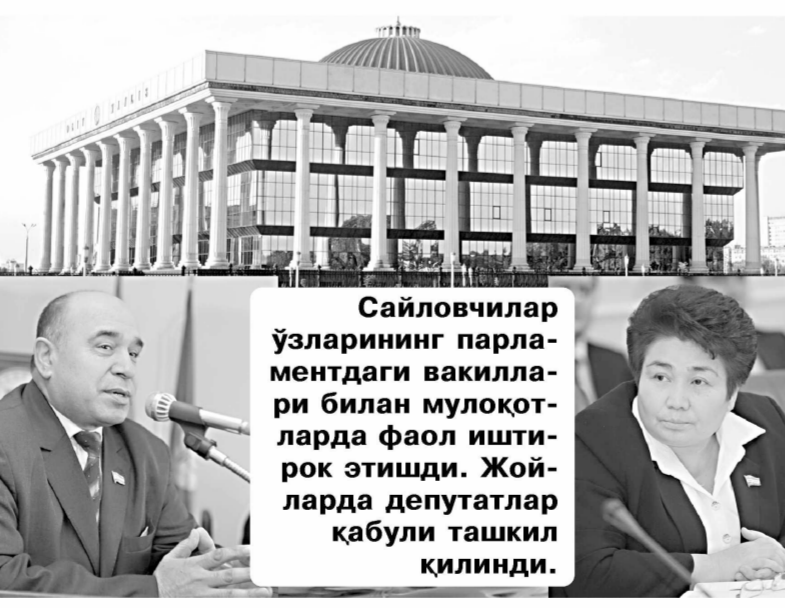
Сайловчилар ўзларининг парламентдаги вакиллари билан мулоқотларда фаол иштирок этишди. Жойларда депутатлар қабули ташкил қилинди.

партиялар тўғрисида»ги қонунга киритилган ўзгариш ва қўшимчалар орқали сиёсий партияларнинг маҳаллий ижтимоий-иқтисодий масалаларни ҳал этишдаги роли ва ўрни янада мустаҳкамлангани, шу боис яратиб берилган имкониятдан электрот манфаатларини ҳимоя қилиш йўлида самарали фойдаланиш кераклигини таъкидлади. Депутат учрашувлар пайтида сайловчилардан тугган қўллаб-қувватлаш жавоб берди, кўтарилган масалаларни депутатлик ваколатлари доирасида ҳал этиш учун тегишли