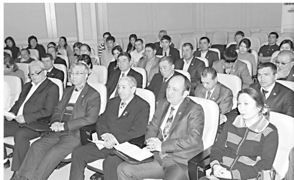
20 та масала партия гуруҳларида кўриб чиқилган бўлса, 2 та масала доимий комиссиялар йиғилишлари, 9 таси эса сессиялар муҳокамасига киритилган.

— Менимча, партиянинг дастурий мақсадларидан келиб чиқиб, «Истиқбол» ёшлар қаноти фаолиятга имконияти чекланган ёшларни ҳам кенг жалб этиш лозим, — деди ЎзХДП «Истиқбол» ёшлар қаноти Қорақалпоғистон республика бўлими қошидаги «Ёш сиёсатчи» клуби координатори Хурлиман